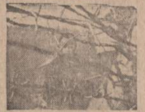
The Iron Curtain Isn't soundproof.

She can't come to you for the truth, but you can reach her. Radio Free Europe does get the truth through.