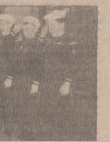
LJS Bebrų dalinys su vadovu, šventės iškilmų metu. Šios dienos bebrai — steigėjas Lietuvos laivyno būsimi jūrininkai.

Pasiekęs Macapan, Amazonės deltoje, šulcas ant savo luoto uždėjo denį, padarė stipresnį vairą ir pusrūpinę uždangalą ant kokpito, į luoto vidų sukrovė 10 svarų sausainių, 100 oranžų, šokolado, uogienės, pamidorių sunkos ir geriamo vandens. Iš-