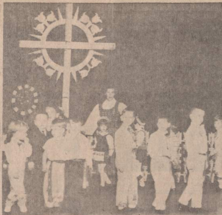
Montessori namelių mokiniai sukasi ratelį ir dainuoja "Aš einu į svečius..."