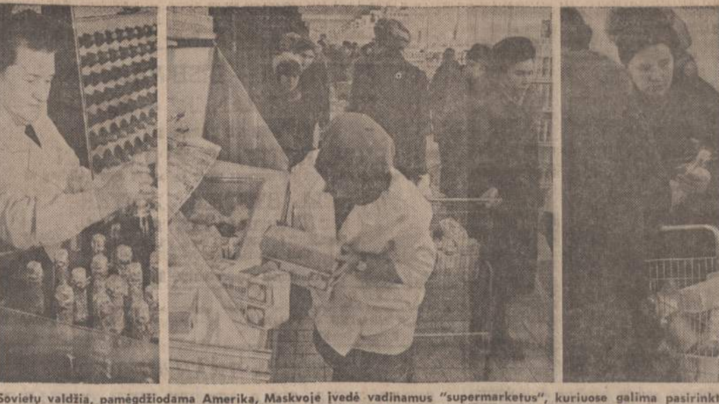
Sovietų valdžia, pamągdžiodama Ameriką, Maskvoje įvedė vadinamus "supermarketus", kuriuose galima pasirinkti įvairiausių prekių. Rusėms patinka didelės krautuovės, bet ir ten moterėlės tenka stovėti eilėse ir laukti prekių.

KURIAM GALUI MOKĖTI DAUGIAU? PIRKDAMI NAUJUS AR VARTOTUS AUTOMOBILIUS SUTAUPYKITE NUO $500 IKI $1,000. BALZEKAS MOTOR SALES "U WILL LIKE US" CHRYSLER • IMPERIAL PLYMOUTH • VALLIANT 4030 Archer VI 7-1515