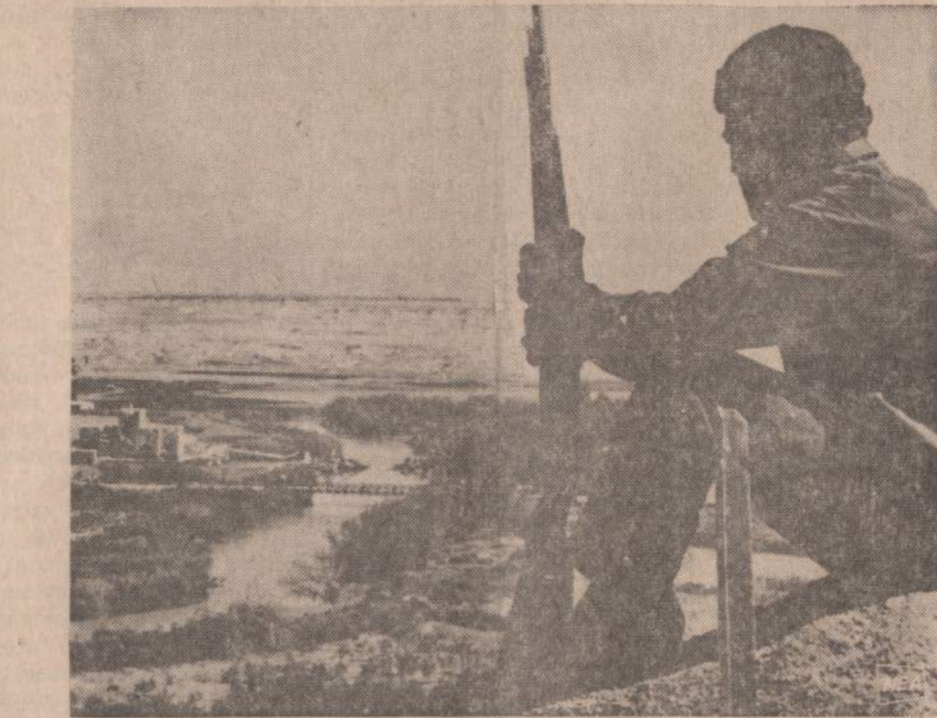
Israelio karys saugo Jordano pasienį. Paveikslė matosi išgarsėjęs Allenby tiltas. Paskutinėmis dienomis įvyko susisaujimo Jordano pasienyje. Karalius uždraudė užpildinėjimus, bet Jordane įsiveisė Sirijos partizanai neklauso karalius patarimų. Izraelį jie puola ne iš Egipto ar Sirijos, bet iš Jordanijos.

Lietuvos laisvei priartinti. Tauta laukia iš mūsų lojalumo, meilės ir ištikimybės. (E)