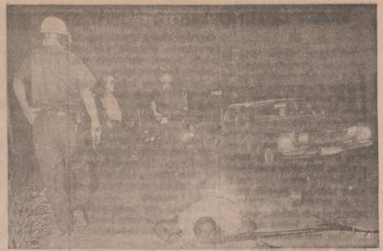
Newarko, N. J., riaušių metu negrai apipletė daugelį krautuvių. Paveiksle matome vieną negrą, bėgusį iš krautuvių ir nepaklausių policijos įsakymo sustoti. Prezidento komisijai negrai skundėsi, kad riaušių metu policija labai žiauriai elgėsi su negrais, juos žaudė be jokios atodaros. Newarko buvo už nuoty policininkų.

b. Šv. Kazimiero kapinių sklypų laikytojai niekada nepasisakė prieš pakeitimus, reikalingus kapinių gerinimui,