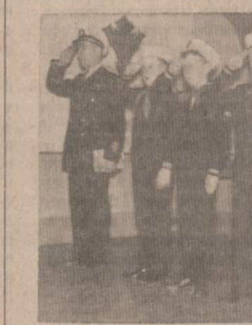
LJS Bebrų dalinys su vadovu, šventės iškilmų metu. Šios dienos bebrai — steigėjas Lietuvos laivyno būsimi jūrininkai.

Išilgai skylant, gaunasi reikalingas luoto plotis. Vidų išskaptavus, gaudavosi "casco" (kriauklės) tipo luotas, kurį J. Šulcas pavadino "Jūros karštingė".