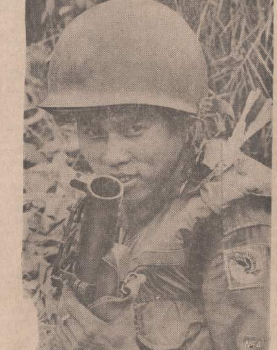
Pietų Vietnamo karys pasiruošęs paleisti mortarą į komunistų užimtas pozicijas Saigone priemiestyje. Šis karys tiek prisipratino paukštelį, kad šis nesitraukia nuo jo peties net ir kovų metu.

Ili dekretu paliko jį generalinio štabo viršininku iki 1969 metų. Vėlonis 1960 metais vadovavo Prancūzijos atominės bombos gamybai ir dalyvavo Sacharos dykumoje ją sprogdinant. Jam buvo pavesta numalšinti generolų sukilimą Alžire. Generaliniam štabui jis vadovavo nuo 1962 metų.