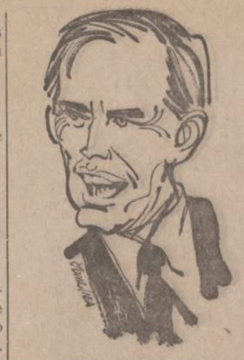
Pietų Afrikos gydytojas Christian Barnard, pakeitęs ligotą širdį sveikai, dabar važinėja po pasaulį ir aiškina gydytojams įgytas žinias. Dr. Barnard mano, kad gydytojams dar trūksta daug tikslų informacijų.

Conquest, kaip ir mes, sako, kad už deportacijas pirmoj eilėj atsakingas Stalinas. Krinta kaltė ir tiems politbiuro nariams, kurie, gelbėdami savo kailį Staliniui pritarė. Nors drauge su Be-