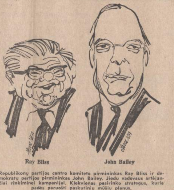
Respublikonų partijos centro komiteto pirmininkas Ray Bliss ir demokratų partijos pirmininkas John Bailey. Jiedu vadovaus artėjančiai rinkiminei kampanijai. Kiekvienas pasirinko strategus, kurie padės paruošti paskutinių mūšių planus.

nių gyvena turtingose valstybėse su nedideliu procentu beraščių, su pakankamom maisto atsigarom ir nemažais ūdarbiais. Kitos dvi pasaulio dalys turi menkus ūdarbius, daug beraščių ir mažai maisto. Gyventojų didėjimas kaip tik ir yra didesnis tose neturtingose šalyse.