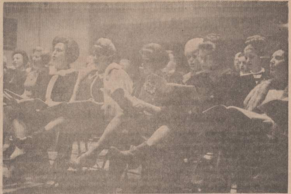
Lietuvių Operos moterų choras. Čia daug pažįstamų veidų. Jaunos motinos, palikę savo mažuosius vaikučius vyro globai, ilgas vakaro valandas praleidžia besiruoidamos „Fidelio“ operos spektakliams. Jos atiduoda savo didžiąją auką lietuviškosios kultūros labui.

„Fidelio“ čia pat. Dar keletas dienų ir pakils Marijos aukšt. mokykl. uždanga. Kovo mėn. 23,