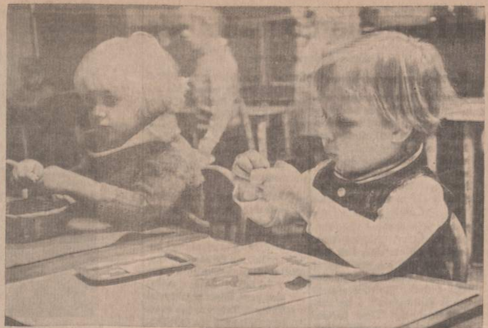
Amerikos Lietuvių Montessori draugijos Vaikų Namelių auklėtinės prie darbu. Dešinėje mažoji mokinukė klijudama ne vien tik rusišką rankutę rašymui, bet taip pat lavina spalvų bei formų pažinimą.

Operos vadovybė pranešė, kad šį kartą dekoracijos jau baigtos, nors premjera dar bus tik už kelių savaičių. Nors visuomenė pagėdavo dar ir ketvirtą spektaklį, tačiau jo, greičiausiai, nebus, nes simfoninis orkestras turi ankstyvesnių įsipareigojimų ir gali dalyvauti tik trijuose spektakliuose. Siems trims bilietai jau beveik visi išpirkti. Visi pasiūlymai, eina prie pabaigos. Dirigentas A. Kučiūnas šioje operoje pasiėmė ir režisieriaus pareigas, kurios nėra lengvos, eilėje su nepailstančiu idealis-