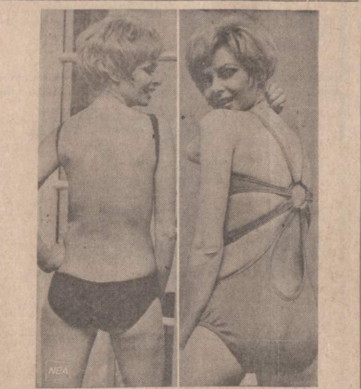
Šių metų maudymosi kostiumėlių pati paskutinioji moda. Saulės mėgėjos turės progos gerai pakaitinti pečius. Jau nuolės tvirtina, kad vyrai tu pečius taip pat domisi.