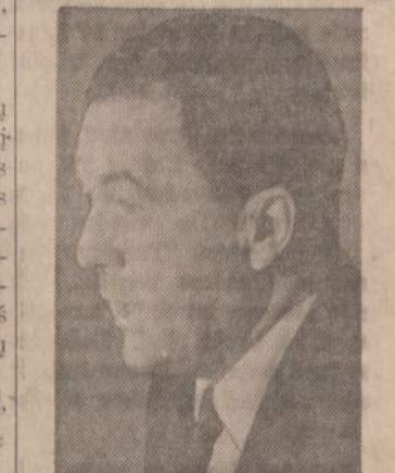
Advokatas Theodore W. Kheel pataria pakeisti vadinamą Taylor įstatymą. Įstatyme nėra numatyta arbitracija savivaldybių tarnautojams. Jeigu nepavyks taarnautojams susitarti, tai prasideda savivaldybės tarnautojų streikas. Tarpininkas Kheel mano, kad arbitracijos paragrafas išvengtų streikų.

Kova prieš "tylos sąmokslą" apie Lietuvos nepriklausomybės reikimą dar toli nelaimėta, bet lietuvių informacijos aidai jau daugelio politikų ir laikraščių pasisakymuose sklaido abejojimus jos prasmingumu ir skatina skirti jai dar daugiau dėmesio, lėšų ir darbo. (E)