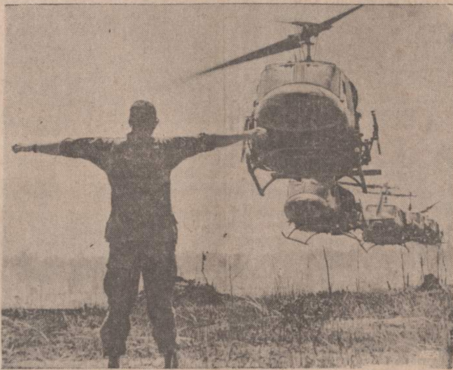
Pradėjus komunistams pulkti Amerikos karo centrus Vietname, į Bien Hoa malūnsparniais atnešti kariai apsaugoms sustiprinti. Parašūtininkas rodo atskridusiems lakūnams, kurioje vietoje patogiausia nusileisti.

4,000 rublių namui statyti. Pusė tos sumos reikės grąžinti per 15 metų. Valdžia duos 400 rublių galvijams pirkti. Pusė tos sumos teks grąžinti per 5 metus.