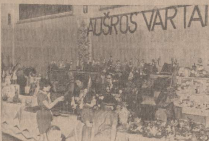
Vienas iš daugelio paviljonų Chicago Kaziuko Mugėje. "Aušros Vartų" skaučių tunto prekystaliai — paruošti pirkėjams — prieš mugės atidarymą.