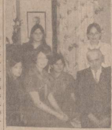
IŠ APSILANKYMO PAS KARIUS VETERANUS

Atlikusios uždavinį, gabijietės vėl renkas iš sueigon ir dalinasi iškylos įspūdžiais. Vienos giedrios, kitų veiduose nostalgija, trečios nesusprantamu jausmu bando apčiuopti ir įvertinti šią neeilinę ir "kitokią" sueigą. Susirinkimas baigiasi, o kan-