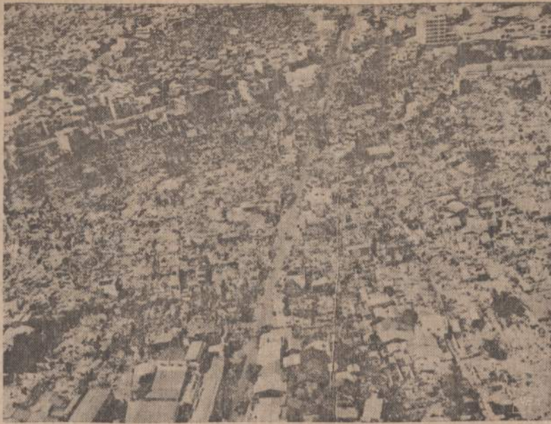
Saigono priemiestyje Čolon buvo įsistiprinę komunistai. Iš Čolono jie tikėjosi užkariauti visą Saigoną, bet jiems nepavyko. Saigono apylinkėse komunistai dar turi ginkluotų gaujų, bet šiandien jau visiems aišku, kad sostinės jie neužims. Taip iš lėktuvo atrodo komunistų išgriautas Čolonas.

Naujienu administracija turi daug gražių ir nebrangių knygų, kurias galima tik už kelis dolerius įsigyti. Knyga yra geriausias žmogaus draugas, tad ir Tamsta įsigyk bent keletą tokių draugų.