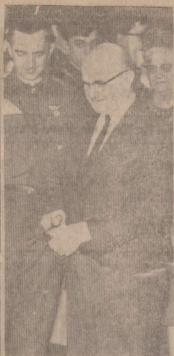
CHICAGOS KAZIUKO MUGĖS ATIDARANT

paruošti sveikinimą lietuviui kariui ar nepr. kovų dalyviui. Gi suskridusios į Jaunimo Centrą, vyr. skautės ir kandidatės sužinojo, kad sveikinimų paruošimas nebuvo vien lituanistinės ar skautiškos pratybos, o lie-