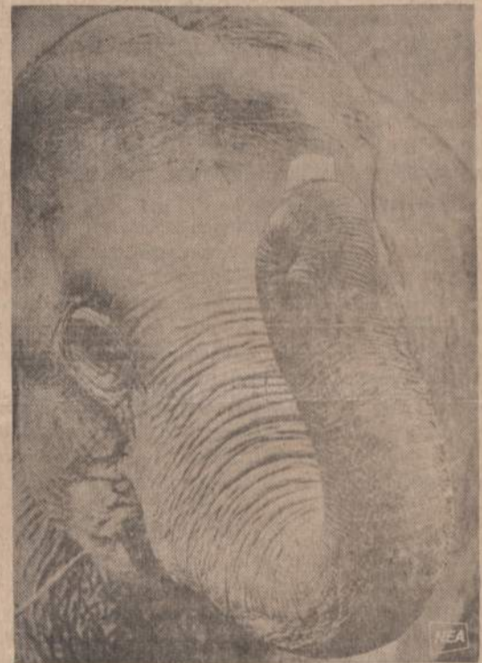
Vyrauja įsitikinimas, kad drambliai bijo pelių. Bet šis didysis Hamburgo zoologijos sodo dramblis ne tik nebijo pelių, bet parodo, kad jis gali baltą pelytę gana aukštai iškelti.

Jeigu nori sužinoti naujaušias ir tikriausias žinias, kas dedasi pasaulyje ir okupuotoje Lietuvoje — skaityk dienraštį “Naujienas”.