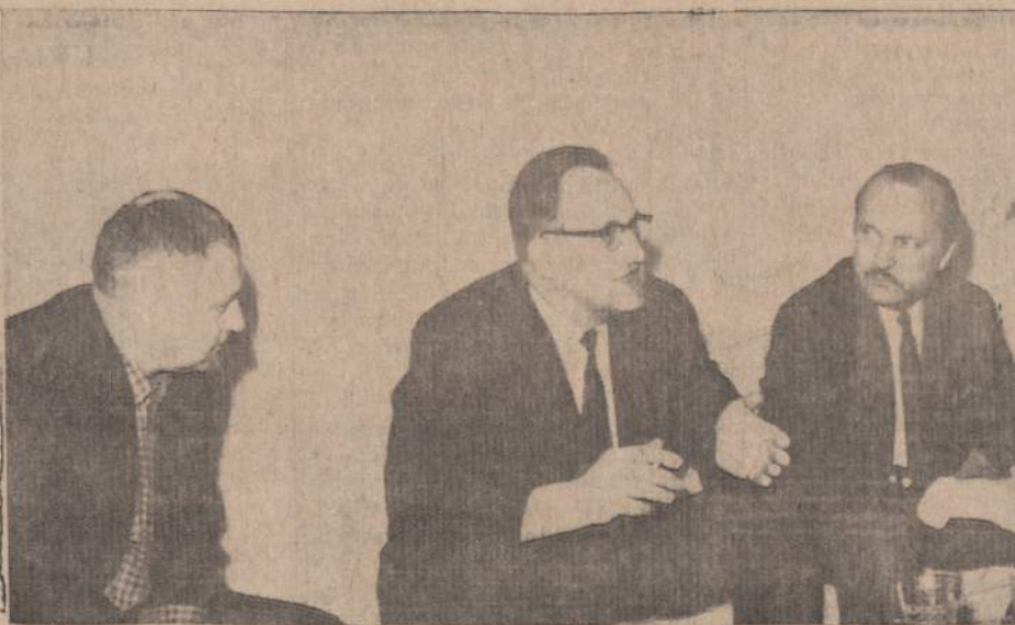
"Fidelo" operos išvakarėse Čikagos Lietuvių Operos pirmininkas...