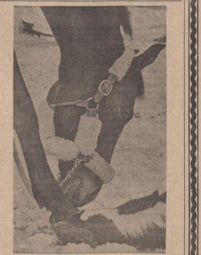
Pradėjus šeiškai uostinėti arklio kanopą, arklys nespyrė ir nekando...