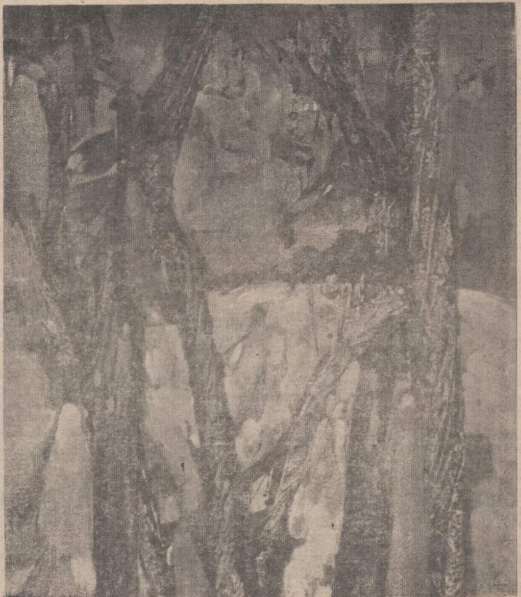
DAIL. PRANAS LAPE