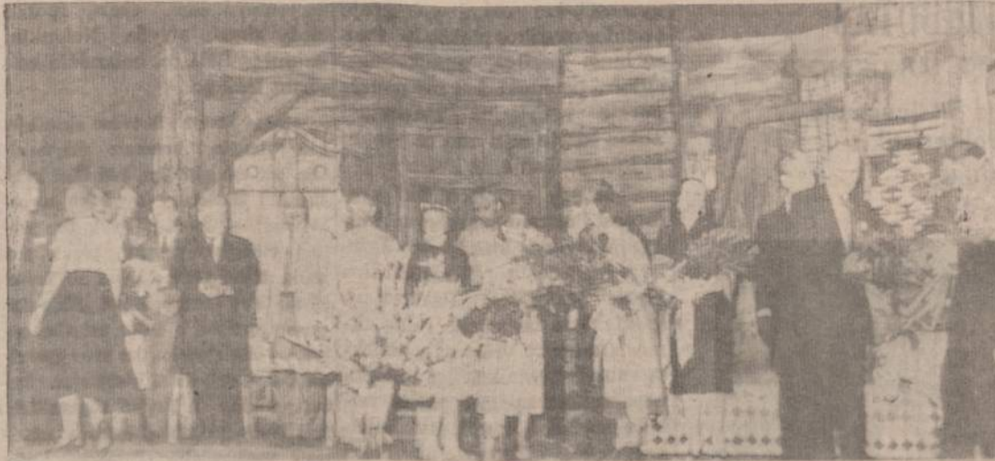
Po IPOLITO TVIRBUTO pastatymo Čikagoje 1958 m. gegužės 3 d. "Pažadėtoji Žemė".