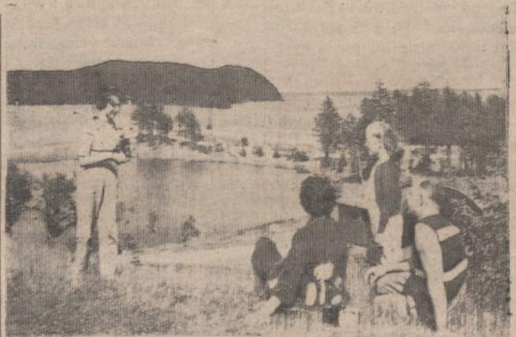
Kai ateis vasara, vėl bus linksma ir gražu.