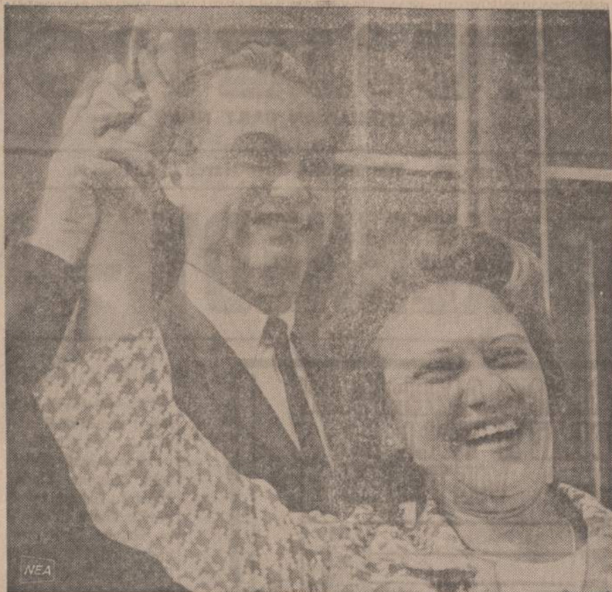
Buvęs Alabamos gubernatorius George C. Wallace ir jo žmona Lurleen Wallace, 1966 metais laimėjusi rinkimus gubernatorių pareigoms. Čia ji žiausiai laimėjimu. Dabar gubernatorė yra ligoninėje. Du kartu jai jau buvo plaunamas ir gydomas vidurių vėžys, bet gydytojai nepajėgia jo apstabdinti.

Teke nugirsti, kad Dariaus ir Girėno komitetas jau mažą teturį lėšų ir be paramos vargu šiemet galėtų tą paminėjimą suruošti. Norima, kad šiais sukaktuviniais metais paminėjimas ir iškilmės prie Dariaus ir Girėno paminklo būtų įspūdin-