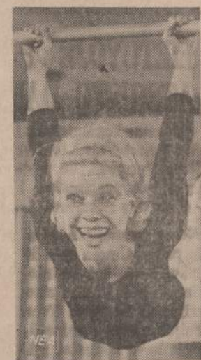
Artistė Betsy Palmer mėgsta gimnastiką. Kiekvieną dieną ji praleidžia po porą valandų ant paralelių arba prie kitų gimnastikos įrankių.

Afrika turi didžiausią mirtinų ratą, augščiausią analfabetizmo (nemokančių skaityti ir rašyti) skaičių ir žemiausias uždarbio pajamas bei trumpiausią amžių pasaulyje. Nedaug geresnėje padėtyje esanti Azija (išskiriant Japoniją) ir Lotynų Amerika (išskiriant Argentiją, Čilę ir Urugvajų).