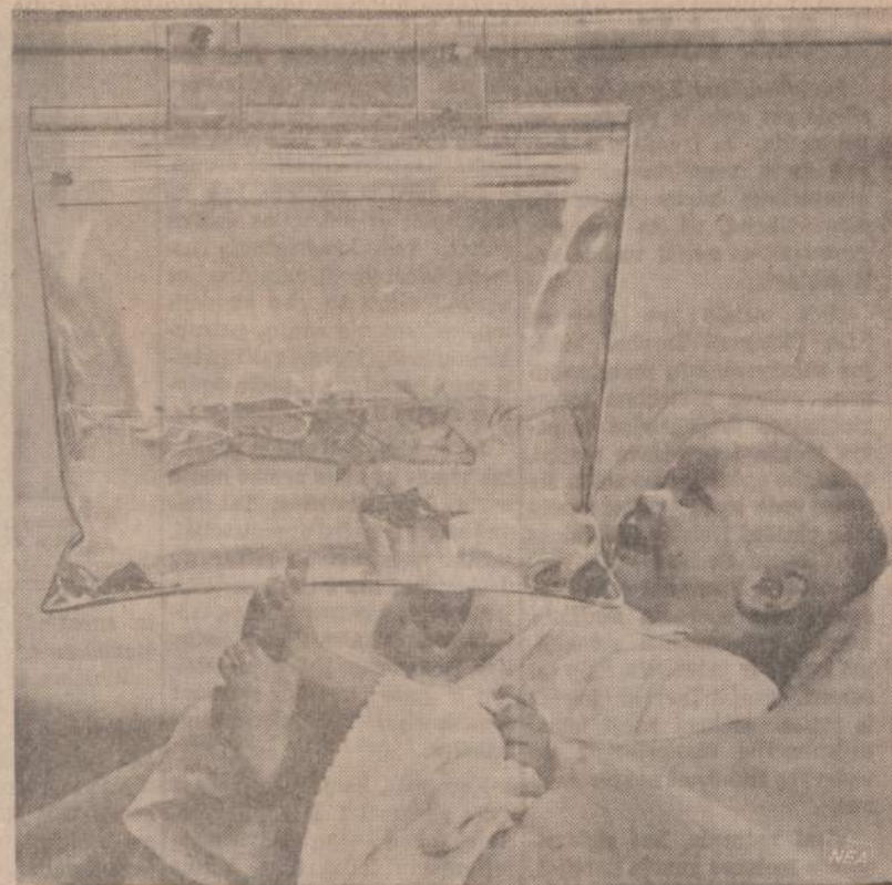
Naujagimiams išgalvoja įvairiausių priemonių pasauliui pažinti. Paveiksle matome pilną maitinamą vandenį, kuriam įleista gyva žuvelytė. Naujagimis susižavėjęs jos judesiais.