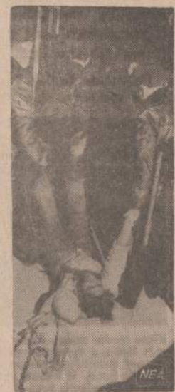
Prezidento paskirti komisijai maitinimo priežiūrai iširti negrai skurdai, kad policija su jais žiauriai besielgianti. Savo tvirtinimui įrodyti jie pakliso šia fotografija, rodančia Chicago policiją praeitais metais vilkusių nerimą kelusį negra jaunuoį.

SKAITYK PATS IR PARAGINK KITUS SKAITYTI NAUJIENAS