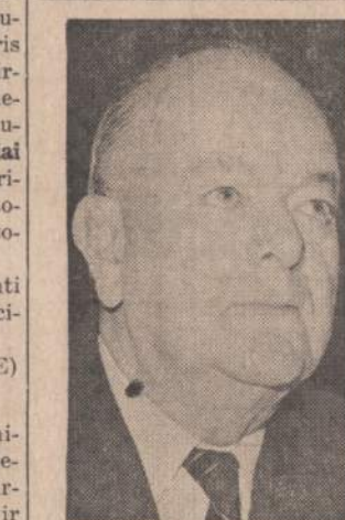
Cyros R. Smith paskirtas JAV prekybos sekretorium. Šis 68-ųjų metų vyras ligus metus buvo American Airlines bendrovės pirmininkas. Senatas apklausinėjo prezidento pasirinkta vyrą ir patvirtino jį sekretoriaus pareigoms.

LONDONAS. — Britanijos užsienio reikalų ministeris George Brown pasitraukė iš vyriausybės. Jo vieton paskirtas, jau kartą buvęs toje vietoje, Michael Stewart.