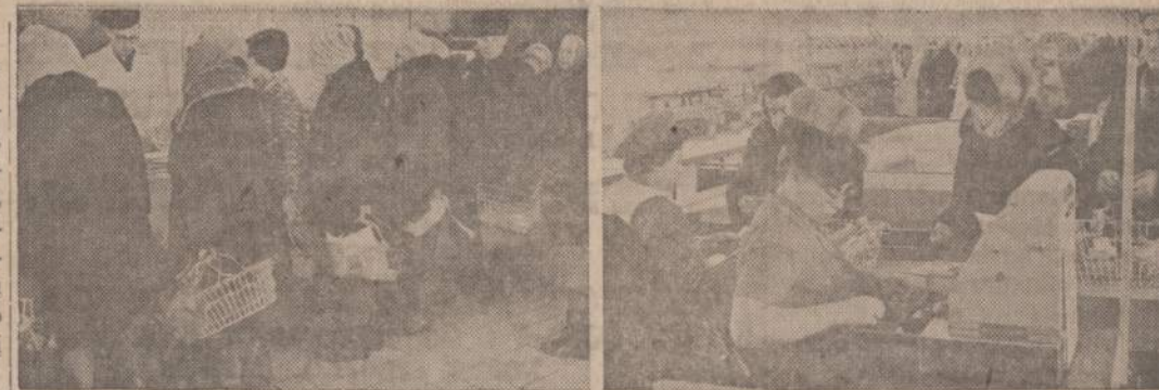
Sovietų valdžia Maskvoje atidarė didelę maisto krautuvę, bet nepasirūpino pagaminti didesnių maisto atsargų. Krautuvėse yra pakankamai gazuoto vandens ir degtinės, bet nėra šviežios žuvies ir sviesto ir kitų maisto produktų. Be to, darbininkams geresnio maisto kainos neįkandamos.

"U WILL LIKE US" CHRYSLER • IMPERIAL PLYMOUTH • VALLANT 4030 Archer VI 7-1515