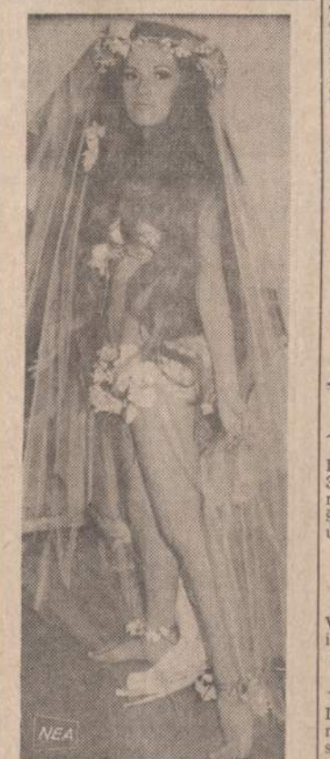
Amerikoje jaunavedės yra nepaprastai kuklios. Jos pasirenka formalias ir padarias vestuvines suknelės. Pa-veikite matome paskutiniu metu par-ryžiečių jaunuolių perkamas vestu-nes suknelės. Amerikoje vargu ras-tum bent vieną jaunuolį, kuri pana-šioje sukniuje eity prie altoriaus.

retos progos, visi kuo skaitlingiausiai dalyvaus. Pastalyme dalyvauja 33 artistai. Atvažiuokite nevalge, bus valgykla, kur galėsite skaniais ir sveikais valgiais pasisotinti. Veiks laimės šulinys, kiekvienas bilietas bus laimingas. Programa prasidės punktuotai. Nesivėluokite. Bilietai gaunami Marginiuose ir prie įėjimo.