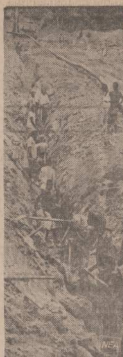
Tautininkas darbininkai kasa grovį aliejaus vamzdžiui praveisti. Dirba 1.000 darbininkų. Jie yra pasiryžę nušviesti ir apkašti 1,062 mylių vamzdžiui liesti. Visas darbas ir modėgia kainuos 38 milijonus dolerių. Vadovybė mano, kad rugėjo mėnesį darbas jau bus baigtas.