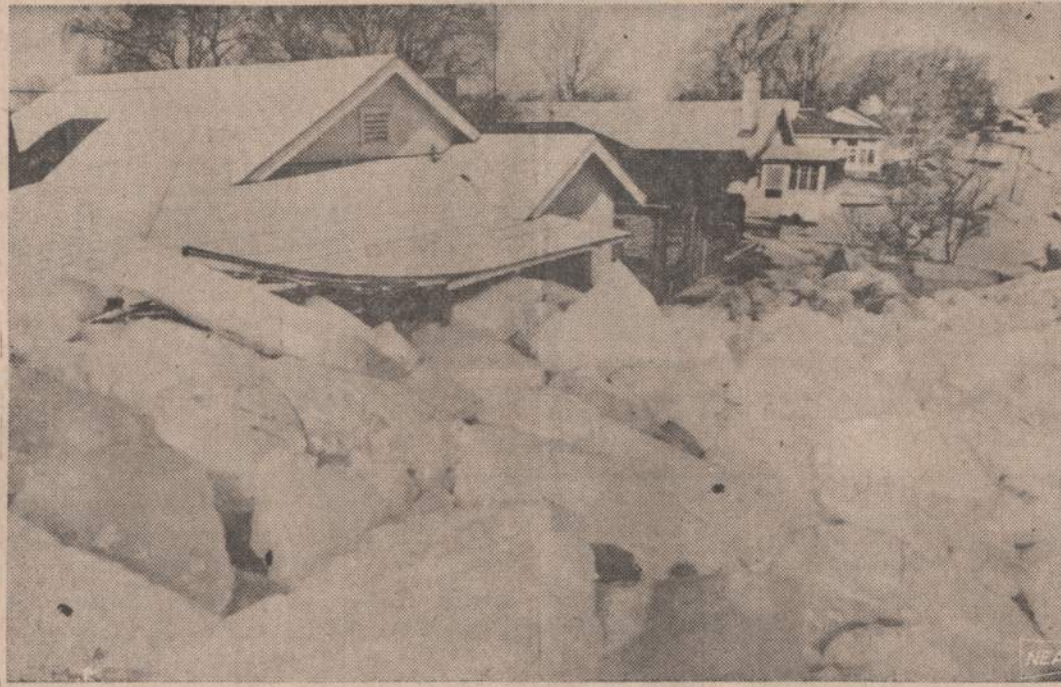
Šiaurės Michigan valstijoje ir ypač Saginaw įlankoj smarkiai snigo ir siautė stiprus vėjas. Jis buvo toks stiprus, kad užvertė Bay City miestelio gatves, medžius ir namus dideliais ledu gabalais.

Sovietų valdžia pasisakė už pasaulio aukso kainų pakėlimą. Aukso pabrangus, gal ir jiems apsimokėtų parduoti savo atsargų dalį, tačiau paskutinių savaičių spekuliacijoje sovietai nedalyvavo.