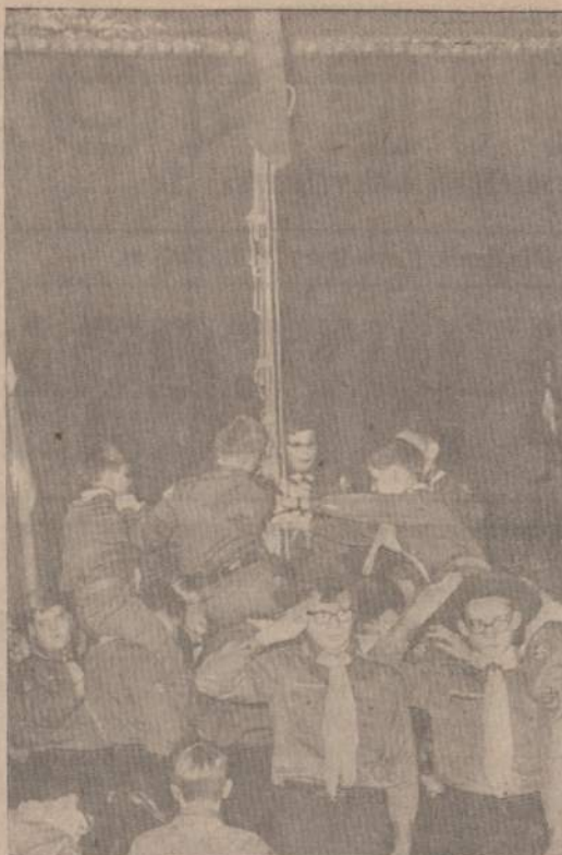
LIETUVOS VELIAVĄ IŠKELIANT