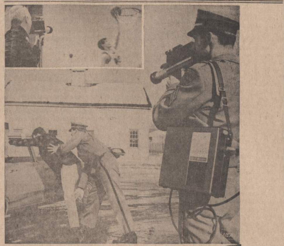
New Yorko policija bando naują foto aparatą, galintį fotografuoti ir rekorduoti įvairius veiksmus. Jis užrašo policijos įsakymus ir visus pasikalbėjimus. Jis tikis žaidimams, nes užrašys teisėjų įsakymus ir žaidėjų veiksmus. Jis bus geras ir didesniems susirinkimams.