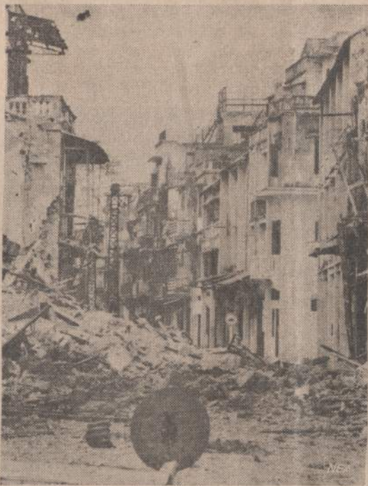
Praskridus didiesiems Amerikos bombonešiams, Haiphonge paliktas toks vaizdas. Japonų agentūra paskelbė šią fotografiją, kurioje matosi įspėjimas, liepiantis žmonėms neiti į bombarduotą sritį, nes ten gali dar būti sprogneįmų.

Kaip žinoma, New York Times nepasizymi per dideliu dosnumu koncertą išpildytojams. Šitoks palankus kritiko žodis smuikininkei ir jos draugams turi būti ypatingai malonus.