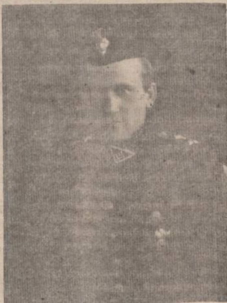
Lietuvos aviacijos lakūnas vyresnysis leitenantas Antanas Gustaitis. Vėliau šis jaunas inžinierius buvo paskirtas Lietuvos aviacijos viršininku ir pakeltas į generolo laipsnį.