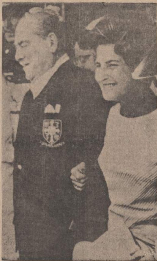
Pietų Afrikos dantistas Dr. Philip Blaiberg, žmonos lydinas, išveža iš Groote Schuur ligoninės. Prieš pustrčio mėnesio jam buvo išimta sugedusi širdis ir įdėta netikėtai mirusio dirbtuvės darbininko sveika širdis. Dr. Blaiberg jaučiasi labai gerai. Po operacijos jis tiek sustiprėjo, kad pats gali laisvai vaikščioti. Jis planuoja netolimoje ateityje gydyti dantis.

Jėzuitų ordino leidžiamas laikraštis "America" išspausdino straipsnį, kuriame paremiamos vienuolių pastangos pertvarkyti gyvenimą vienuolynė. Los Angeles mieste profesoriaują 29 jėzuitai kunigai atskiru raštu, viešai paskelbtu, remia "Skaisčiausios širdies" vienuoles, jų kovoję prieš kardinolo nutarimą. Santa Barbara mieste yra vie-