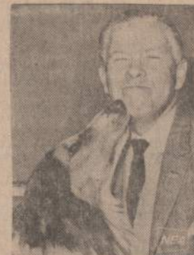
Kalifornijos senatorius George Murphy ir televizijoje išgarsėjusi Lassie senatė buvo paminėti, kai buvo svarstomas reikalas neterėti krašto oro ir vandens. Kino aristo ir Lassie programos daug padėjo šią sunkią problemą suprasti.

Meksikonų kilmės amerikiečių reikalavimai sustiprinti meksikonų kultūros reklamą ir mokymą, be abejo, yra priešingi amerikizacijos procesui. Kai kurie lietuviai savose parapijose, savose mokyklose ir šv. Kazimiero kapinėse Chicagoje pradedo baidyti savosios kalbos, savųjų tradicijų ir imasi airiškės pataikauti, gi meksikonai