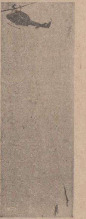
Vietname malūnsparnis kelia keturis karius, negalejusius pasprukti iš priešiško laukimo pozicijos. Amerikos malūnsparniai lektuvai dažnai panašiu būdu iškelia prieš šio teritorijon patekusius lakūnus arba nuklydusius karius.

Komunistinėje Lenkijoje piliečiai tiems reikalams neturi reikalo daryti jokių išlaidų. Jiems valstybė užtikrina dietą su mažiausiu kalorijų kiekiu. Tai dar vienas įrodymas, kaip komunistinė sistema rūpinasi žmonėmis.