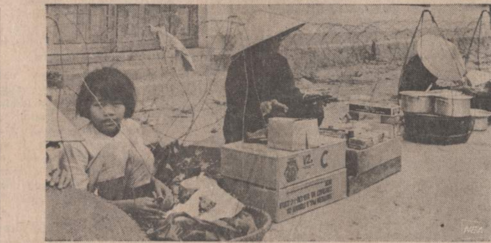
Kovų metu buvo išgriauta didelė Hue miesto dalis. Užtruks kelis metus, kol miestas bus atstatytas, bet juodoji rinka jau šiandien veikia. Hue mieste galima nusipirkti JAV cigarečių, pastos dantims valyti, muilo ir įvairių Amerikos kariams priklausiusių dalykų. Kainos, aišku, didelės.