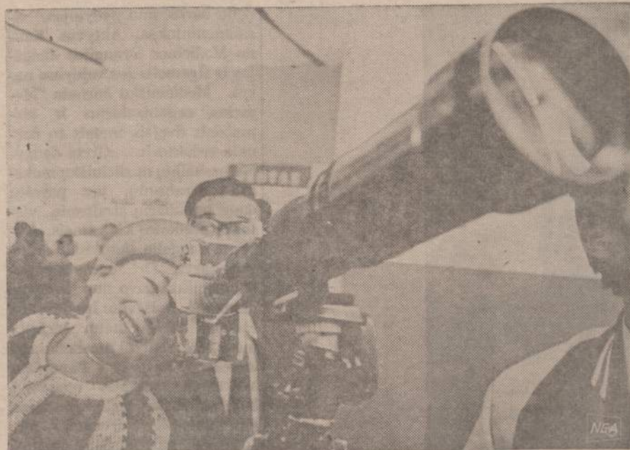
Japanų foto aparatų parodoje lankytojams buvo rodomas 1,000 milimetrų lešys. Visi nori pamatyti paveikslą aiškumą. Jaunas berniukas tiek susižavėjo, kad negali atsitraukti.