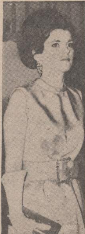
Prezidento duktė Luci Nugent atvyko į Baltuosius Rūmus, kad galėtų dalyvauti Paragvajaus prezidento Algreto Stroessner vaišėse. Stroessner jau ilgus metus valdo Paragvajų. Šiomis dienomis jis buvo dar kartą išrinktas eiti prezidento pareigas.