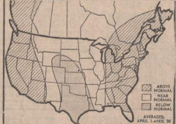
JAV Oro Biuras praneša, kad balandžio mėnesį oras bus normalus. Pictuose bus vėsesnis, centre normalus, o rytų ir vakarų pakraščiuose jis bus šiltesnis.