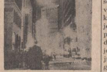
Atlanta, Ga., iš Equitable Life degančio namo, 37 aukšto, degantys griuveliai krinta ant kity arti stovintį namą.

Michigan valstijoje tinkamų meškerojimui vietovių sąrašą galima gauti Lansinge.