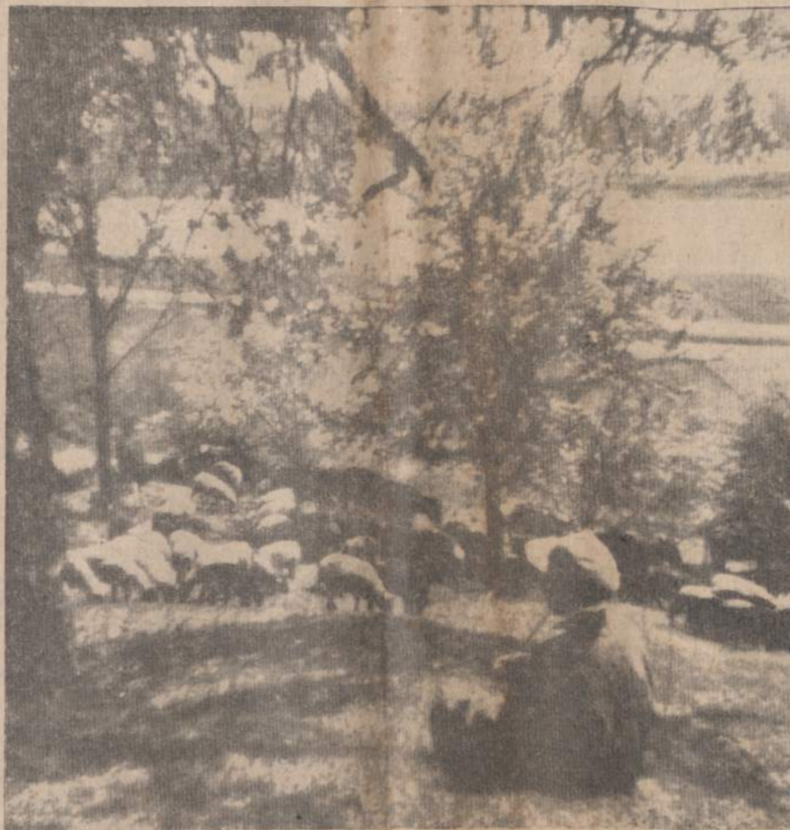
PAVASARIS LAISVOJE LIETUVOJE

Apie pavasario gėlę — leliją tiek žinoma, kad jau 3,000 metų prieš krikščioniškąsias Velykas Eufrato upės slėnyje prie pirmųjų pavasario skelbėjų priklausė lelijos, kurios būdavo vartojamos kaip svarbiausia pavasario džiaugsmo puošmena.