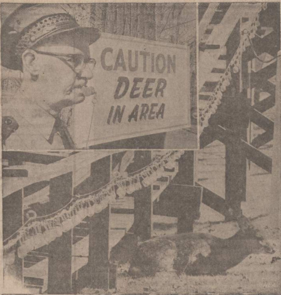
Ohio, prie Cedar Point pramogų centro, orai atšilus atsiranda stirniukių. Čia matome vieną ba- siilinsinį prie pakelto tako. Policijai jos sudaro rūpesčio, kuomet trukdo judėjimą. Kartais jud- ijimą tenka pasukti kita kryptimi.

SALES "U WILL LIKE US" CHRYSLER • IMPERIAL PLYMOUTH • VALIANT 4080 Archer VI 7-1515