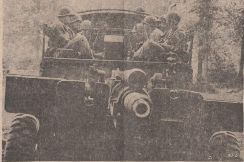
Moderniškoji JAV armija yra mechanizuota. Pašaukti atsarginiai per kelias dienas gali sėsti į paruoštus sunkvežimius ir važiuoti į paskyrimo vietą.

Senatas sudaromas iš 31 asmens. Jame būtų 12 atstovų, parinktų rinkiminės kolegijos. Jie visi būtų balti. Genčių vadų susirinkimai parinktų 12 negrų ir likusius 17 paskirtų valstybės galva — irgi baltasis.