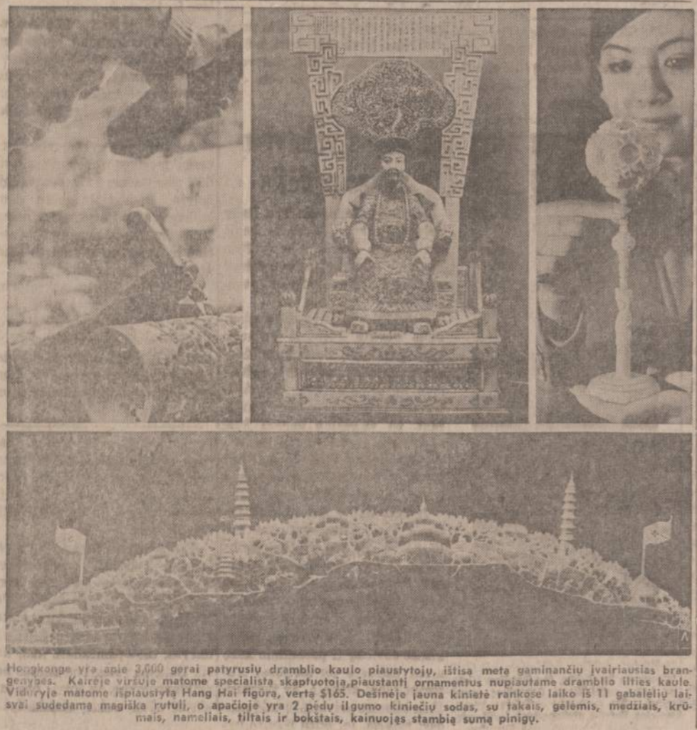
Hongkonge yra apie 2,000 gerai patyrusių dramblio kaulo piaušytojų, išsisa metą gaminančių įvairiausias brangenybes. Kairėje viršuje matome specialista skapfuotoja, piauštanti ornamentus nupiautame dramblio lūties kaulu. Viduryje matome piaušytą Hang Hai figurą, vertė $165. Dešinėje jauna kinietė rankose laiko iš 11 gabalielių laisvai sudedama magiška rutulį, o apačioje yra 2 pedu ilgumo kiniečių sodas, su takais, gelėmis, medžiais, krūmais, nameliais, tiltais ir bokštais, kainuojąs stambia sumą pinigų.