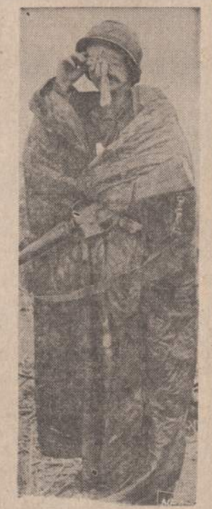
Nežiūrint vilčių taikingai užbaigti Vietnamo konflikta, ten kasdien žūsta ar būna sužeidžiami Amerikos jauni vyrai. Čia matomas sužeistas karys, laukias lietuje atskendant helikopterio, kuris jį nugabens į ligoninę.

MASKVA. — Sovietų Sąjunga išsiuntė į Hanojų 10,000 Gegužės 1-mos dovanų — siuntinių, kuriuos laivas iš Vladivostoko veža į Haifoną.