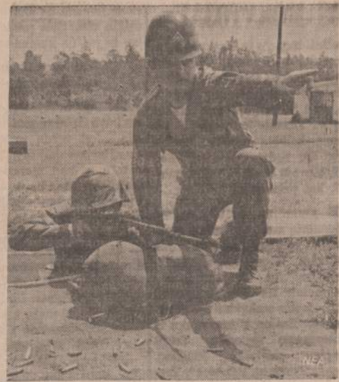
Jaunas karininkas moko naujai pašauktą atsarginį, kaip pataikyti į taikinį. Pašaukti atsarginiai turi susipažinti su pačiais naujaisiais šautuvais.