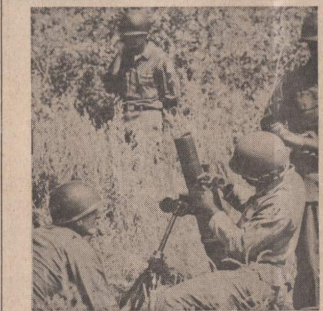
Atsarginiai apmokomi vartoti pačius moderniausius ginklus. Kartu su jais supažindinami su kovos nuotaikomis tarnybos pašaukti gydytojai. Pavaiksta matome atsarginius ir gydytoją, stebinti pasiūrusius karo veiksmams.

Vėlykų šventės ir visuomet geras pirklių sezonas daugeliui mažmeninės prekybos verslininkų siemet nebuvo perdaug linksmas. Pardavimas dėl riaušių ir gaisrų sumažėjo ir nepateisino dedamų vilčių. Prekyba pagyvėjo tik nuo praeito trečiadienio, bet anksti uždarnos parduotuvės ir jaunimui gatvėse rodytis draudžiamas laikas labai paveikė pajamas. Atsiliepi apyvartai ir dėl sekmadienio gedulo krautuvių uždarymas. Sėkmingiausia prekyba buvo priemiesčiuose.