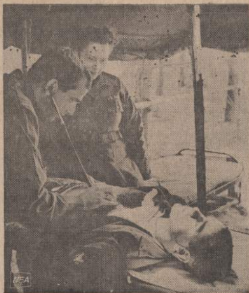
Jauni Amerikos gydytojai supažindinami su karo sąlygomis. Pa-veiksle matome patyrusį gydytoją, duodantį instrukcijas ir Vietnamą skrendančiai slaugai.

Rezoliucija dėl lietuvių kalbos naudojimo parapijose bei religinėje praktikoje