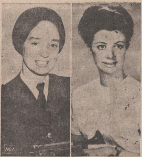
Kairėje matome Kanados kariuomenėje tarnaujančios moters uniformą ir šukuoseną, o dešinėje matome tą pačią karę moderniška pasidabinusią.

Abiejuose greitkeliuose kai kurie judėjimo takai bus uždaryti, atsižvelgiant į taisyms ar statybos darbų pobūdį.