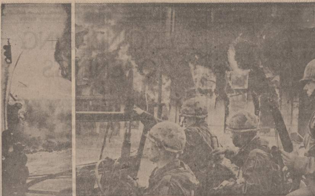
Praeitą savaitę Washingtono negrai sukėlė didelius gaisrus ir padarė milijoninius nuostolius. Daugiausia nukentėjo negru apyvenčių distriktai. Jie degino krautus ir gyvenamus namus. Naikinimo darbas apstojo, kai atvažiuo kariuomenės dalinys. Paveikste matome karius, neleidžiančius padegėjų į kitus distriktus. Kairėje ugniagesiai bando gesinti gaisrus.

Dar vienas šio vėlyvo pavasario šokių vakaras įvyks šeštadienį, gegužės 4 d. Hollywood