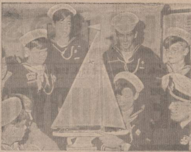
PRIE "PERKŪNO" JACHTOS MODELIO

Vienetams sparčiai darbuojantis nesnaudžia ir Brolijos vadija