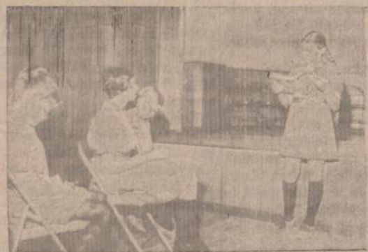
PROGRAMOS GABALELIS TĖVYNĖS SUEIGOJE

Visas fotografijas siųsti komisijos pirmininkės vardu: O. Zailskienė 1934 So. 48 Court, Cicero 50, Ill.