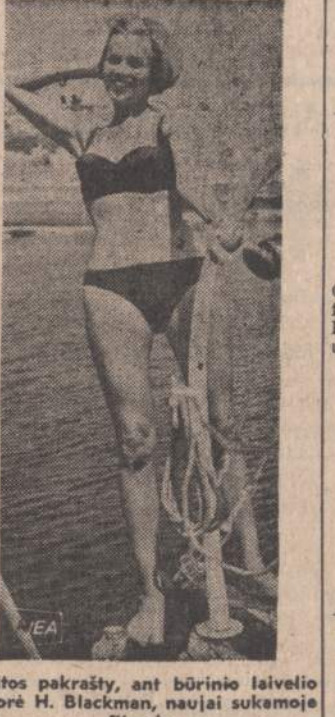
Maltos pakraštį, ant būrinio laivelio aktorė H. Blackman, naujai sukomoje filmoje.

"Puota Jūros Dugne" įvyks š. m. balandžio mėn. 20 d. Western Ballroom. Pradžia 8:30 v. vak. Dėl rezervacijų skambinti LA 3-5499. Bilietus prašome atsiimti iš anksto Margučyje auo 7 val. vak. iki 8 val. vak. (Sk)