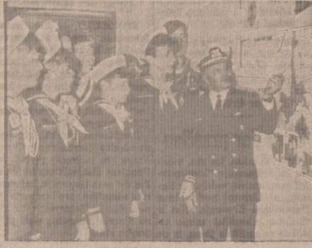
LIETUVOS ZEMELAPIO PRATYBOS

— Griebkite pieštukus, vyrai. Šiandien pradėsime su egzami-