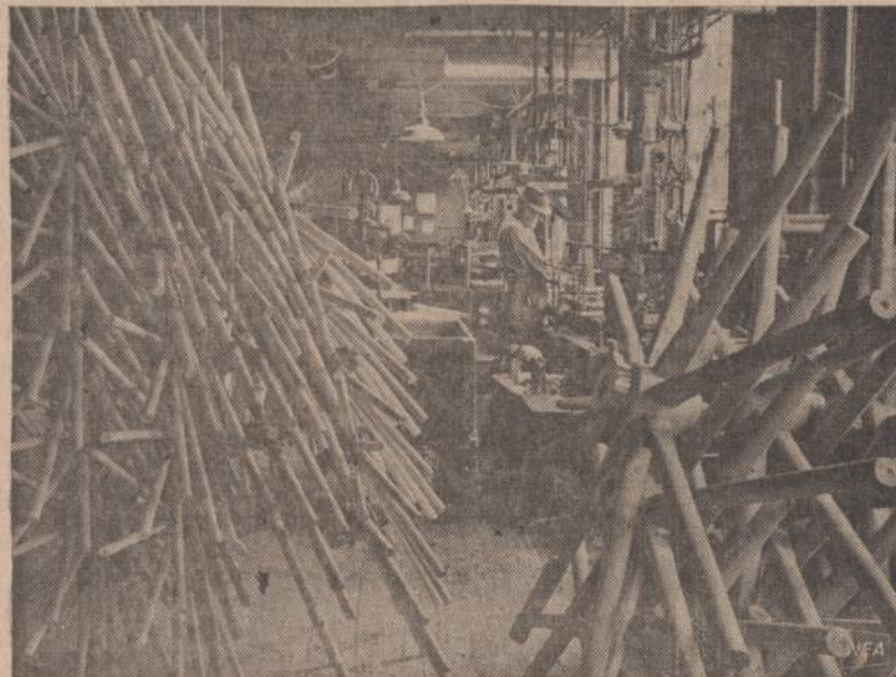
Amerikoje susisiekimas labai sumodernėjo, bet vis dėlto kiekvieną mėnesį reikia pagaminti medinius ratus 1,200 vėžimui. West Chester, Pa., miestelyje yra 100 metų senumo medinių ratų dirbtuvė, kurioje visa laika dirba 15 darbininkų. Viršuje matome du seniausius ratus, ruošiančius buksas ir renčiančius stipinūs. Apačioje matome medinių ratų dirbtuvės vaizdą.