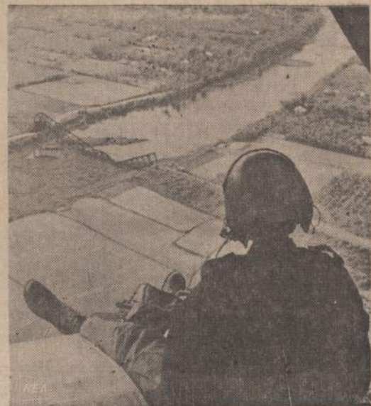
Amerikos karys, malūnsparnių nešamas į Khe Sanh sritį, iš viršaus mato sugriautą tiltą ir kelių važiuojančius sunkvežimius. Ne tik kariai, bet ir kariuomenės renklais atsargos malūnsparniais gabamos į Khe Sanh sritį.

Mažas vaikas žvėryne klausia mamos, ar liūtai po mirties eina į dangų? “Ne, kur jie eis”, atsakė mama. “O geri vaikai?” “Taip”. “O jeigu liūtas gerą vaiką suėda, kaip tuomet?...”