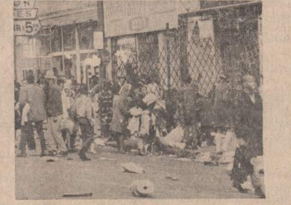
Nušovus Martin Luther King Jr., Baltimorės negrai pradėjo pulki krautuves ir nešisiose ristas prekes. Krautuvements išdaužė langus ir išsukinėjo duris. Paveiksle matome negrus, bandančius pralaužti krautuvių apsaugojančias grotas.

5 d., būtų buvę mažiau neramumų. Policininkų sąjungos prezidentas pasiuntė merui telegrama, pagirdamas jo pareiškimą ir sveikindamas jo drąsą.