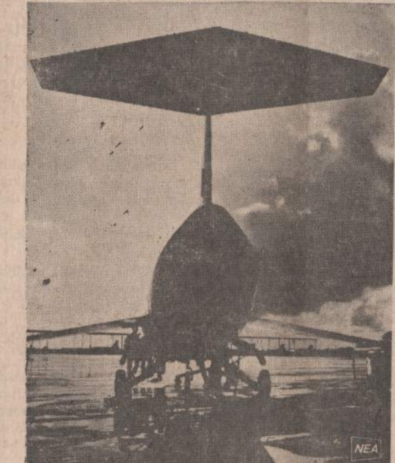
Paveiksle matomas F-104 lėktuvas gali tuojau pakilti į orą ir pasitikti atskendantį priešą. Jis skrenda du kartus greičiau, negu garšas. Jis gikluotas kulkosvaldžiais ir kanuole. Šiais lėktuvais jau gali ginti visa šiaurės Amerika.