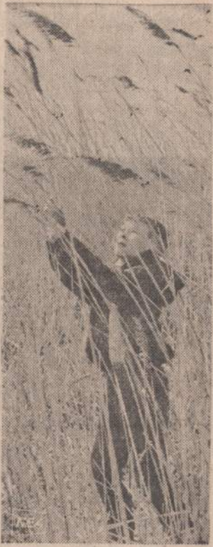
Paežerėse nendrės labai didelės. Dešimties metų berniukas, įėjęs į nendrą, prapuola. Viršūnė tikrai palenkdamas gali pasiekti.

Savo laiku ji yra dainavusi didžioje Europos ir Pietų Amerikos scenose.