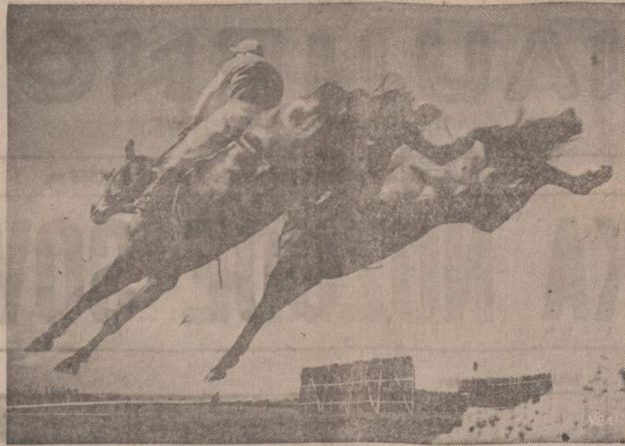
Šie du arkliai lenktyniaudami lengvai nugali aukštes klūgėjų užvaras. Lenktynės vyksta Cheltenham (England).

Užklausti kai kurie tos išvykos dalyviai, kas jų kelionę per Maskvą į Lietuvą finansavo, gautas atsakymas: "Ją finansavo kai kurie lietuviai intelektualai, kurių pavardžių prašė viešumai neskelbti. Jų suaukotų pinigų kelionės išlaidoms apmokėti nepakako: "turėta nuostolių 500 dolerių." Kas tuos susidariusius nuosto-