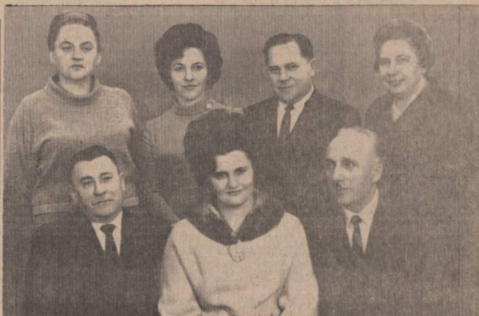
ČIKAGOS AUKŠTESNIOSIOS LITUANISTIKOS MOKYKLOS TĖVŲ KOMITETAS

Kavalieriai nežino, ar galima moterims pasiūlyti cigara. Pasirodo, kad etiketė nedraudžia pasiūlyti cigara, teigiu žino, kad ta moteris rūko cigaras. Paveikslas matome artistę Janis Paige, New Yorko pobūvyje rūkančią cigara. Jauna artistė nekrepia dėmesio į gelimą plaučių vėžį.