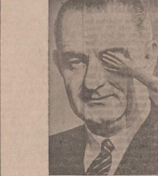
New Harmony, Ind., mokykloje vaikams buvo liepta pereikti prezidento Johnsono paveikslą iš vienos klasės į kitą. Vienas vaikas neša paveikslą, o kairėje vaikai užėjo ranką ant kairės preziden- to akies.

Kad tie keliami faktai apie Masaryko mirtį nėra malonūs kai kuriems šių dienų Kremliaus valdovams, tai visai suprantama. Pavyzdžiui, jie negali būti malonūs Brežnevui ir Suslovui, kurie jau tada buvo aukšti Kremliaus pareigūnai. Priminimas, kaip tada buvo vykdoma Stalino politika, jiems, tur būti, yra nepaken- čiamas. Todėl netenka stebėtis, jog sovietų spauda deda visas pastangas, kad apie tai nebūtų prisiminta. Ir tai ji daro visai paprastai: beveik nieko neskelbia apie tai, kas vyksta Čekoslovakijoje.