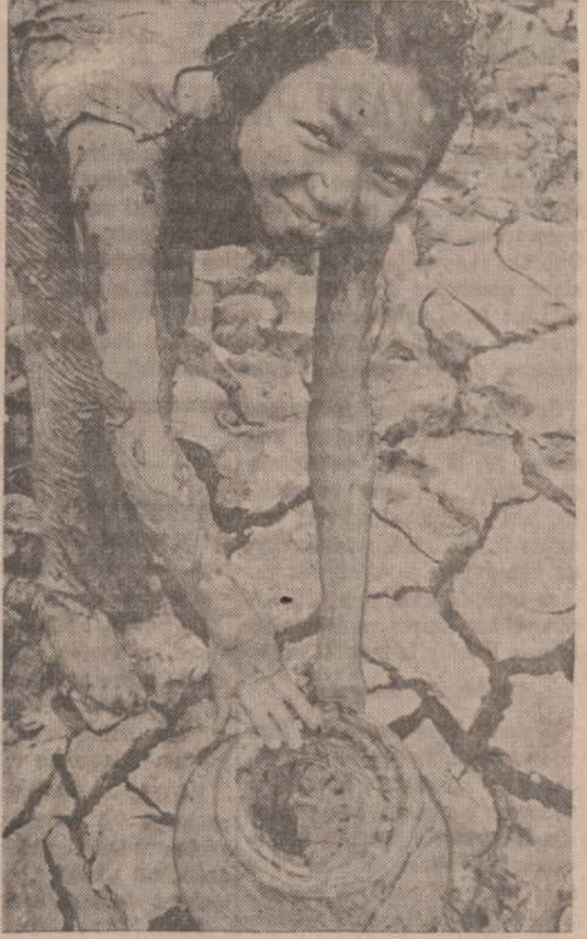
Thailande yra populiarus žuvas dumble. Žuvas ašina vandens pripildytus dumblus. Thailandiečiai vaikai briede į dumbli žuvis priverčia išleisti paviršiu ir tada jas paima su rankomis. Jauną mergaitę pasiima savo krepšį, nos jau laikas eiti namo.

Pokalbis įdomus ir su juo dar sugrįšime. Pietų Amerikos lietuvių gyvenimą ir jo problemas ir mums pravartu arčiau pažinti.