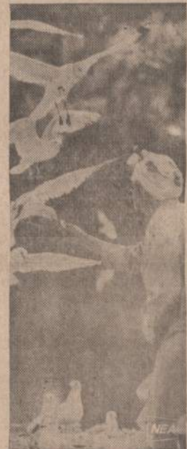
St. Petersburg, Fla. matomi iš rankos maitinami, gracingai ant sparnu ore besilaikantys paukščiukai.