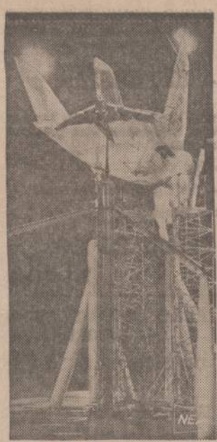
NASA inžinieriai paruošė naują lėktuvo dalį bandymams vėjo tunelyje, kur konstruktoriai stebi ir pataria, kaip oro trintis veikia į lėktuvo charakteristikas.

tautiniai kostiumais, kas tik juos turi. Taipogi pagedaunama kuo daugiausiai mažų vėliavėlių ir asmeninių plakatų.