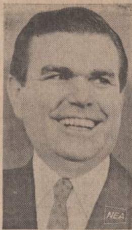
Marvin Watson šypsosi gavęs prezidento Johnsono paskyrimą generalinio pašto direktoriumi. Jis pakeis pasitraukusį Lawrence F. O. Brien.

Tad tie, kurie garsinasi lietuvių atstovaujančių ir jos gyvybės išlaikymu besirūpinančių, turėtų įsitaikinti, kad ne visi tautiniai reikalai spręstini tik pagal savo paties snapą. Kaip tik dėlto dabar nutinka, jog ne tik dvi vėliavos sukabinamos ant bendro stiebo, bet kartais mūsiškė net visiškai "užmirštama" atsišne-