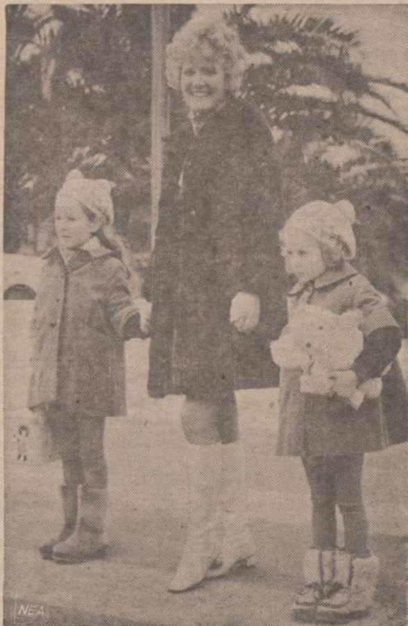
Dainininkė Petula Clark beviešinti prancūzų Rivieroje, su savo dukrelėmis išėjusi pasivaikščioti.