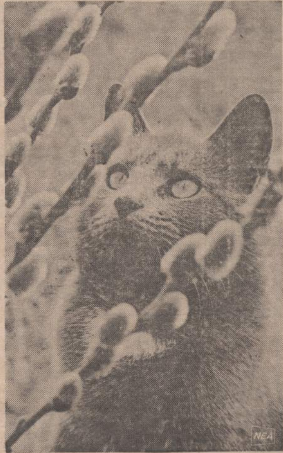
Graži katytė susidomėjusi stebi pavasario gluosnių "kačiukus", kurie yra panašūs į ją.