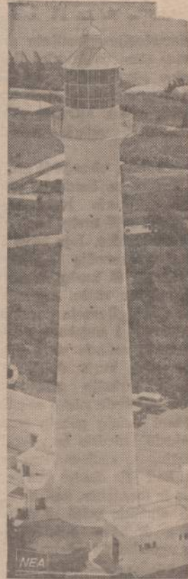
Bermudoje pastatytas švyturys, savo šviesų stiprumu laikomas vienas iš galingiausių pasaulyje. Šviesų stiprumas yra apie pusės milijono žvakių šviesos. Lektuvų pilotai šviesas matys iš 200 mylių atstumo.

Taigi, vežikų pasirodymas miesto gatvėse sukels šiokių tokių permainų ir tam tikrų organizacinių galvosūkių. Bet kai pagaliau sunkumai bus užpakaly, o priešaky pamatysime klusniai kaukšinti su šorais arklį, ne vienas susigraudenęs tursens paskui šią simbolišką eiseną. Iš tikrųjų — koks ultrašiuolaikinis vaizdas: senoviška senamiesčio gatvė, senoviški žibintai, gotika, barokas, lėtai ir monotoniškai riedas juodas vežimas, o iš paskos lyg rojus