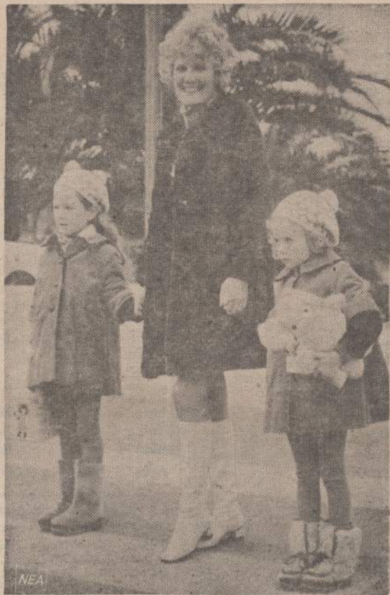
Dainininkė Petula Clark viešinti prancūzų Rivieroje, su savo dukrelėmis išėjusi pasivaikščioti.