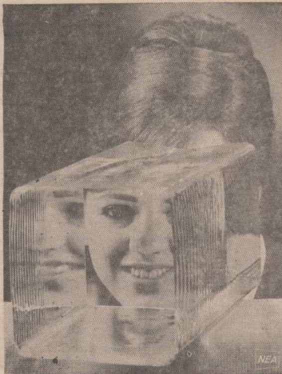
Sumažintas jaunos, gražios mergaitės veidas matomas per didelį optinio stiklo gabalą. Stiklas buvo išstatytas Dallas, Tex., kur vyko optikų konvencija. Jis naudojamas gaminimui mažesnių optinių stiklų.

Mūsų vakarų civilizacija remiasi savo estetika, intelektualinėmis ir demokratinėmis tradicijomis, klasikine Elada. Bet tuose tolimuose laikuose, kada sprogo Santorini sala, visas Balkanų pietų pusiasalis buvo laukinis ir tuščias. Graikija buvo labai silpnai apgyventa pusiau laukinių klajoklių. Vėlesnė jų kultūra pilnai žydėjo pas tuos, kurie gyveno Kretoje, Santorini ir daugelyje kitų salų tarp Balkanų pusiasalio, Atėnų siaurėje ir, iki XV amžiaus prieš K. g., buvo pasiekę ypatingo kultūros lygio ir žibantios civilizacijos. Jau jie naudojo labai sudėtingų formų raštą, užsiiminėjo sportu, įskaitant bokšą ir rungtynes, mėgo jaučių kovas. Išvietėse jau turėjo tekantį vandenį, žinojo ir naudojo savotiškais įrengimais vėsinimui savo gyvenamųjų patalpų, vasaros karščių metu. Jų menas, skulptūra ir piešiniai, ne kiek neblogesni už šio meto skulptūrą ir paįsybę. Jų pasiuntiniai ir pirkliai išvagojo okeanus toli nuo jų gražiosios tėvynės ir jų kariai sėkmingai kovojo net paslaptingoje Kifi. Tie žmonės dabar mums žinomi "minean" vardu, o jų civilizacija — minėnų.