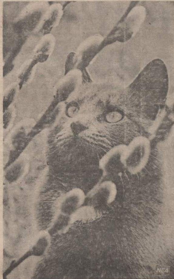
Graži katytė susidomėjusi stebi pavasario gluosnių „kačiukus“, kurie yra panašūs į ją.