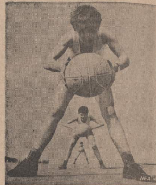
Varšuvoi, perspektyvoje matomi mokiniai treniruojami krepšinio žaidymams.