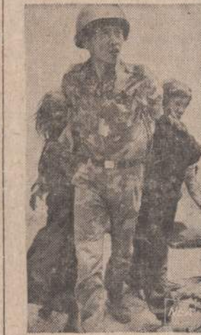
Pietų Vietname karys veda du aklius vaikus prie evakuacijos helikopteria. Vaikai buvo rasti vienam apgriautame name, arti Kho Sanh.

Po šio "kvapometro" įvedimo labai sumažėjo britų tavernų biznis. Alaus bravorai kietai kovojo prieš įstatymo įvedimą, pravedžiuo transporto ministrę Barbarą Castle "Hitleriu su sijonu". Tačiau ir jie dabar mato, kad šis poliejus ginklas apsaugo žmonių gyvybes. Įstatymu labai patenkinti taxi vairuotojai, nes dabar mėgstą išgerti britai daugiau naudojami jų patarnavimais.