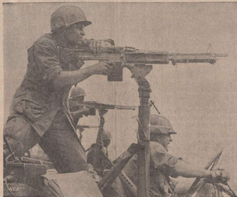
JAV kovotojai, su automatiniais ginklais Pietų Vietname nuo priešų nuvalo kelią, kuris jiems yra reikalingas.

BONA. — Rytinės Vokietijos munitininkai nepraleido dviejų Vakarų Vokietijos piliečių, kurie norėjo traukiniu važiuoti į Vakarų Berlyną. Amerikos, Britanijos ir Prancūzijos komendantai tariasi, kokių priemonių griebtis, kad komunistai nelaužytų susitarimo.