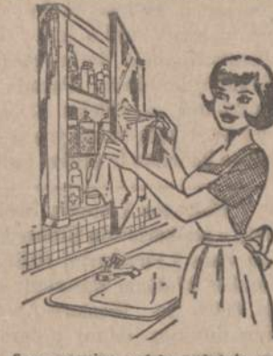
Savo namine vaistų spintelę reikia nepaprastai švariai ir tvarkingai užlaikyti, kaip šiamo vaizdelyje parodyta: išimti visas butelius ir išmazgoti lentynas; patikrinti visus užrašus kad neįvyktų klaidų, nes vaistų sumaišymas gali būti fatališkas, patikrinti, kokiu vaistų trūketa ir juos papildyti kad būtum bet kokiam netikėtomui pasiruocius.

Savo namine vaistų spintelę reikia nepaprastai švariai ir tvarkingai už- laikyti, kaip šiamo vaizdelyje parody- ta: išimti visas butelius ir išmazgoti lentynas; patikrinti visus užrašus kad neįvyktų klaidų, nes vaistų su- maišymas gali būti fatališkas, patik- rinti, kokiu vaistų trūketa ir juos pa- pildyti kad būtum bet kokiam neti- kėtomui pasiruocius.