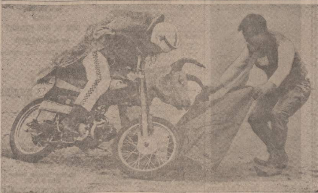
Formosoje, motociklų parodoje, publikai patinkaminti buvo ir tokios bulių žaidynės.

7909 STATE RD. OAK LAWN, ILL. Phone: 636-2320