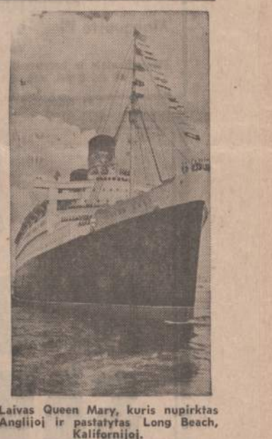
Laivas Queen Mary, kuris nupirktas Anglijoje ir pastatytas Long Beach, Kalifornijoje.