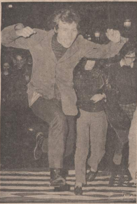
Romoje prieš Ameriką nusiteikę Italijos studentai, trypia ant JAV vėliavos po masinių demonstracijų.

Paskelbta, kad antrasis lėktuvas, sudužęs Tailandijoje turėjo fabrike paliktą defektą, — klijų tubą, kuri skridimo metu