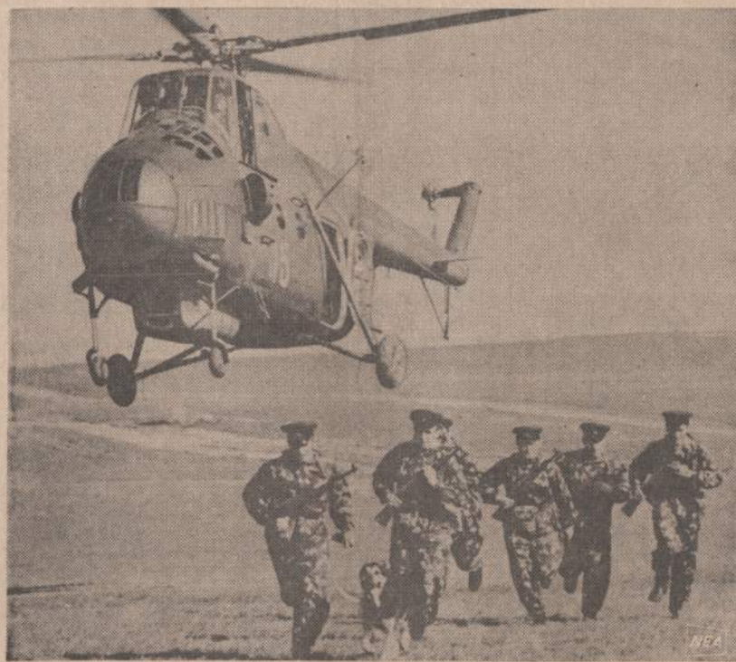
Sovietų malūnsparnis Irano pasienyje išmetė 6 pasienio sargus. Sovietų pasienio sargai visuomet yra pasirodę pulki per sieną perėjusius rusus ar kitataučius. Jie nieko iš sovietų imperijos neišleidžia ir nieko neleidžia.

dalyvauti komunistinės visuomenės statyboje", "galutinai pašalinti šeimos santykiuose žalingas praeities atgyvenas ir pa-pročius". (E)