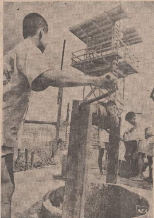
Vietkongas ir šiaurės Vietnamo belaisviai Bien Hoa Pow stovykloje iš šulinių semia vandenį, kuris paduodamas kur reikia. Šiuos įrengimus aptarnauja apie 2000 belaisvių.

Putramentas ragina išaiškinti ir pašalinti tuos rašytojus, kuriems sąjunga yra skydas politinei veiklai prieš liaudies valdžią. Oficiali Lenkijos žinių agentūra R. A. P. puola eilę New Yorko politikų, jų tarpe senatorių Javitsą už tai, kad jie kritikuoja Lenkiją dėl jos kovos prieš sionizmo veiklą Lenkijoje.