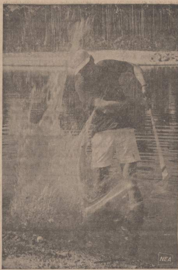
Golfo žaidėjas pasiryžęs išleisti iš keblios padėties, jo sviedinukui nukritus į vandenį. Jis golfą žaidžia Grand Bahama saloje.

Praeitą sekmadienį balandžio 21 d. Hollywood salėje žagariečių linksmas šoknų va-