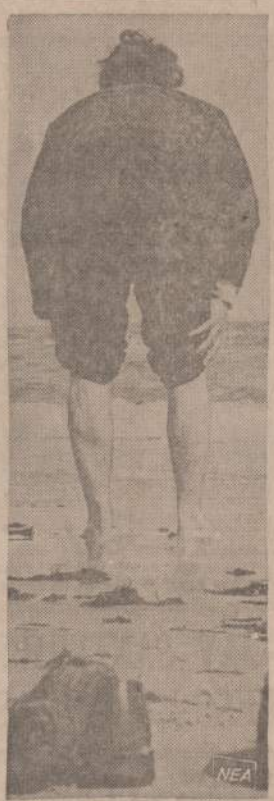
Pasėdėjęs šilta diena prie ežero parkraštyje, vyras neiškentė. Jis nusivė batus, pasiraityto kelnes ir įbrido kelis žingsnius, kad pajestų artėjantį pavasarį. Ligi kelių bristi jis vis dėlto dar nediršo.

Tik įvedus tokią apdraudos sistemą, gydytojai galėtų teikti