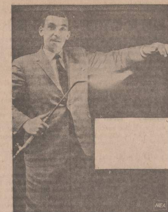
Anglijoje pradėjo gaminti naują nedegantį medžiagą. Audinyje yra daug vilnos, jis šiltas, bet chemikalai padarė jį nedegantį. Jaunas vyrukas degina savo rankovę, bet ji, kaip matome, nedega. Tvirtinama, kad netrukus tokio audinio eilutes bus pardavinėjamos ir Amerikoje.

Nors ir gerokai pavėluotai, mes turime visu griežtumu kovoti už savo sukrautus bendruosius turtus ir tautinius interesus. Kitos tautybės, rasės, padermės ar gentys tegul stotasi savo bažnyčias, mokyklas, namus, kapines. Mes jį turtus rankos netiesime. Tegul tad bažnytinė vadovybė ir jais į mus nesiundo. Anis Rūkas