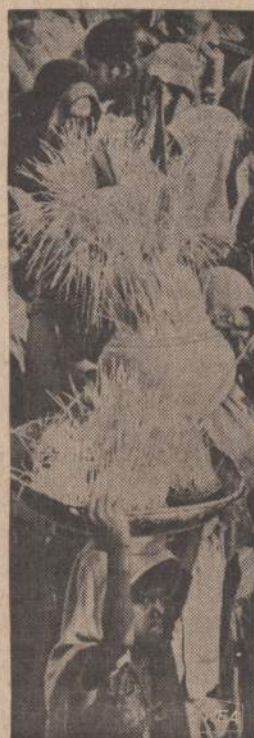
Centralinėje Indijoje maldininkai eina į maldyklą padėkoti už derlių. Ant galvos nešamas krepšys ir grotis su žaliais javų augalais. Po maldų grotis bus paleistas į šventą upę.

1739 So. Halsted St., Chicago, Ill. 60608