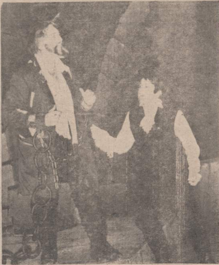
FIDELIO OPEROS VAIZDAS VEIKALO PABAIGOJE

Spalio 5 d. Vokietijos kancleris Max von Baden Reichstage paskelbė, kad Vokietija pripažįsta tautoms apsisprendimo teisę ir leidžia joms laisvai kurti savo valstybes ir vyriausybes. Spalio 20 d. Lietuvos Taryba gavo iš kanclerio pranešimą, kad jai leidžiama sudaryti Lietuvos vyriausybę. Spalio 28 d. Tarybos nariai paruošė laikinąją Lietuvos Konstituciją. Lapkričio 2 d. susirinkusi Taryba vienbalsiai pasisakė, kad liepos 11 d. Valstybės Tarybos nutarimas kviesti herzogą Urachą Lietuvos karaliumi — nevykdomas. Lapkričio 5 d. Taryba remdamosi laikinąja konstitucija, pavedė A. Voldemarui sudaryti pirmąją Lietuvos vyriausybę. Lapkričio 11 d. sudaryta-