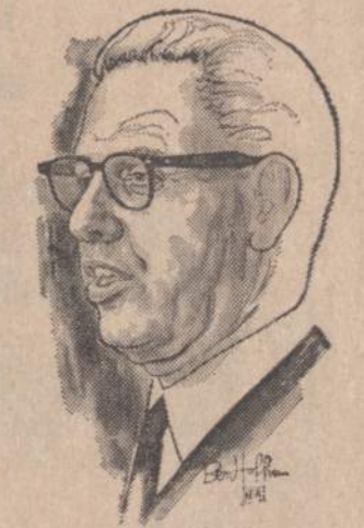
Ambasadorius Arthur J. Goldberg pareiškė, kad jis nesieks jokios administracinės vietos, bet bandys verstis advokato praktika. Jis buvo advokatas, patarėjas, aukščiausio teismo teisėjas ir JAV ambasadorius Jungtinėse Tautose. Dabar nori pastotogauti, o vėliau grįžti prie advokato praktikos.

KARACHI. — Pakistano kariuomenės lėktuvas nelaimėje žuvo 22 asmenys.