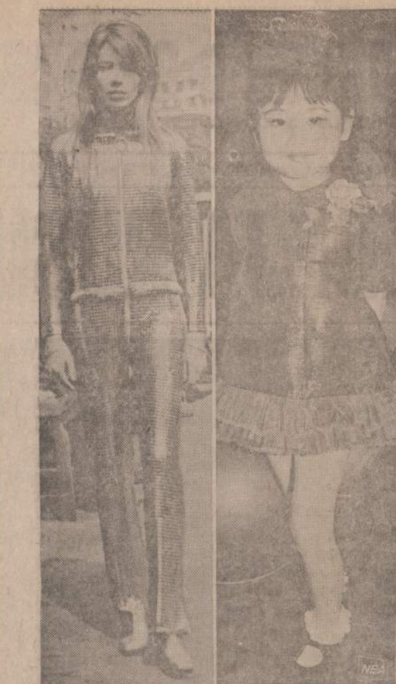
Atrodo, kad moterims pradeda patikti metaliniai apėdai. Kairėje matome Londono dainininkę Francoise Hardy, pasidabinusią metalinėmis ketinaitėmis ir blizgučiais, o dešinėje matome Hongkongo mergaitiukę, pasidabinusią tokios pačios medžiagos suknele.