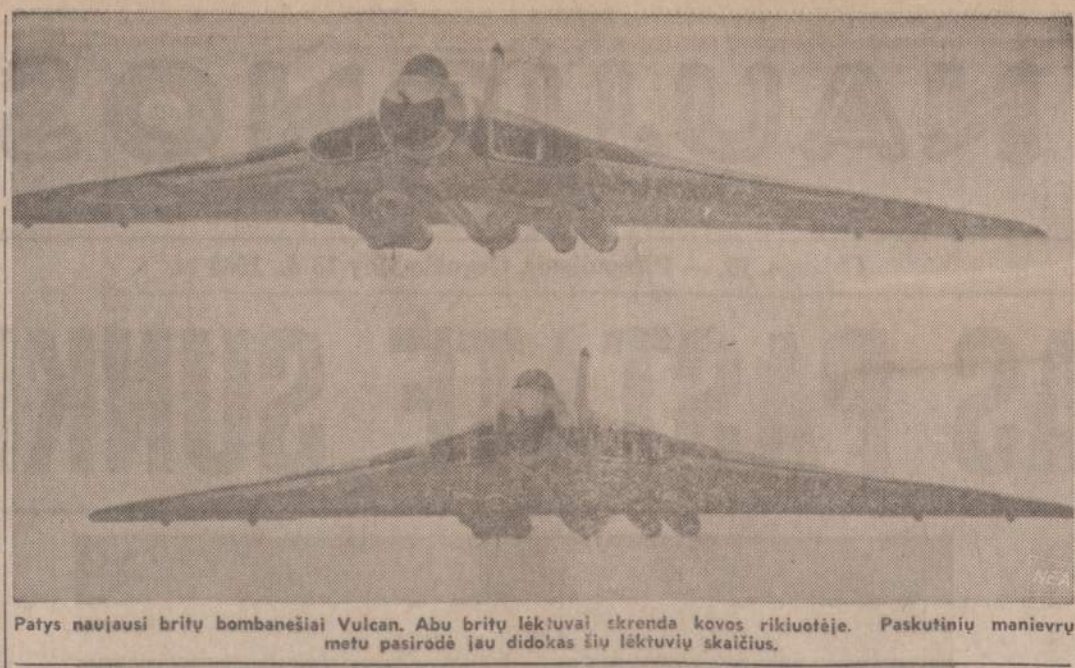
Patys naujaisi britų bombanešiai Vulcan. Abu britų lėktuvai skrenda kovos rikiuotėje. Paskutinių manevrų metu pasirodė jau didokas šių lėktuvų skaičius.

Antra vertus, jeigu naudinga tokia užuovėja vaikiečiams augti ir rankos jų lopsniui pasupti, tai nemažiau reikalinga tokia talka ir tiesiog visai lietuvių. Tam įrodyti čia pat pradėta daug gyvų pavyzdžių, ne vėliau dirbančių (dirbusių) už tūlus vidutinio amžiaus drungnus darbininkus. Štai sėdi nepaliaujantis kurti, i-