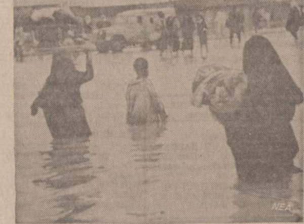
Irako sostinėje Bagdade mažai telydavo. Per 50 metų nebuvo stipresnio lietaus. Bet praėjus ketvirtadienį pradijęs lietus pilte pylė 40 valandų ir sustabdė visą susisiekimą. Paveikslas parodo Bagdado gatvių vaizdus.

narių gegužės 1 dieną, atsilankymą į Oak Forest, kur seneliai buvo vaišinami skaniais valgiais ir kiekvienam įteikta įvairių dovanėlių, be to po tris dolerius pinigais. Dar mūsų organizacijų veiklus geraširdis darbuotojas Frank Strakshus, savais pinigais visiems seneliams išdalino po vieną dolerį ir įteikė jiems sveikinimo lapelius. Raportą pagilino ir kitos komisijos narės.