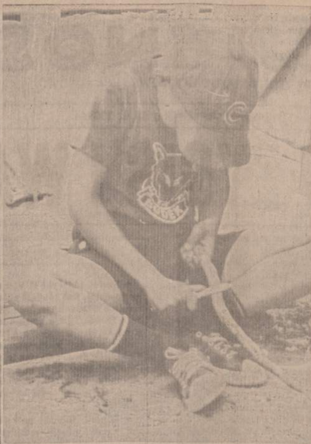
STOVYKLINIO KURIMOSI ĮKARŠTYJE Reikia pasidirbti pakabą indams sukabinti.

ir kiti šį labai svarbų įvykį palaikyti norj lietuviai prašomi visai prisidėti, kad norintieji ir to verti skautai ir skautės