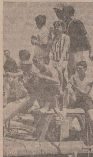
Amerikos jaunimas domisi automobilių lenktynėmis. Lenktynės dar toli, bet jaunimas suvažiuo į Indianapolį, kad galėtų sekti bandymus.