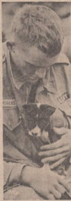
Amerikos karys Vietname rado mąžytį šunytį. Be maisto, šunytį reikėjo šilumos. Karys duoda jam reikalingos šilumos.

Premjeras Wilsonas prisipažino, kad jam nemalonis yra algų suvaržymo nuostatai, tačiau jis nemato Britanijai kitos išeities, kaip tik susivaržyti. Jis pripažino, kad darbo partija neteko turėto populiarumo, tačiau jis nesirošia pasitraukti. Jo nuomone, populiarumas sugrįš atgal, kai ekonominiai reikalai pasitaisys.