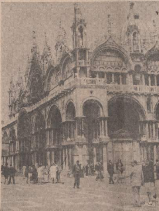
Tvanas suminkštino šv. Markaus bazilikos pamatus, Venecijos gyventojai kreipėsi į Italijos valdžią prašydami paramos. Jie vieni nepajėgia pataisyti padarytos žalos. Visi italai nori ausuoti Venecijoje stovinčią Bizantijos stiliaus maldyklą.

jos bus baigtos statyti, aprūpins plieną ir geležimi Egipto pramonę, be to, dar liks apie 500 tūkstančių tonų eksportavimui. Sovietų Sąjungos ekspertai padės Egiptui išnaudoti jo geležies rūdos kasyklas Baharios oazėje.