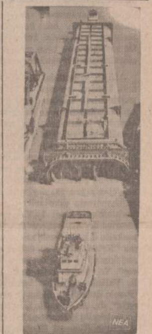
Kalifornijoje Napa upe velkamas 324 pėdų ilgio povandeninis pastatas, kuris San Francisco įlankoje sudarys tunelio dalį. Ilankio statomas povandeninis tunelis San Francisco miesto apylinkėse susisiekimui pagerinti. Šis pastatas bus nuvilktas į paskyrimo vietą ir parandintas. Veliau juo vaikščios traukiniai ir abi pusės.

● Kai kurios moterys tiek blogai vairuoja automobilį, kad policija turėtų joms išrašyti tikečius bent pusmečiui iš karto.