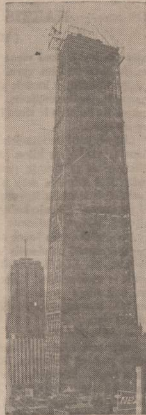
John Hancock Center bus pats aukščiausias namas Chicagoje, šimtas aukštų. Tai antras aukščiausias namas visame pasaulyje. Į John Hancock namą sudėta 42,000 tonų plieno. Name bus įstaigos, krautuvių, garažai ir gyvenamieji namai.

Ramus, epinis pasakojimas nelaukta persoko į dramatinį ir net pagaliau su tragizmo atspal-