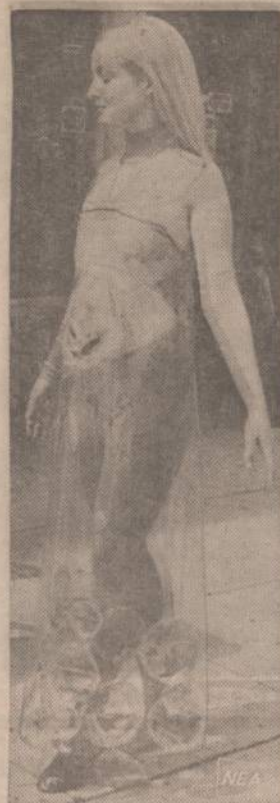
Kalifornijoje 37 metus peršokusios moterys pradėjo dėvėti suknelės su žuvelėmis. Permatomos suknelės parodo dar gražias kūno dalis, o žuvelės, nardydamos plastiniame maišelyje laikomam vandenyje, šildosi grakščios moters kūno šiluma.

Vieno nepaleido. Dėl atsargumo palaikė apkabinusi už pažastų. Patogiai pasodino, po kojom žemą minkštą kėdutę. Apgaubė skotišku plėdu, beveik tokios pat ryškios spalvos, kaip ir šilkinė Goulet pižama. Tuo pat momentu, betaisant, belvarbant, sovė į galvą gydytojo įspėjimas: "Dabar tik tyla — visiškai ramumas. Pasistenki, mano geroji..." Atsiminė ir taurtum išgastis nusmelkė, karštis pašoko į smilkinius: "Iš tikrųjų ką