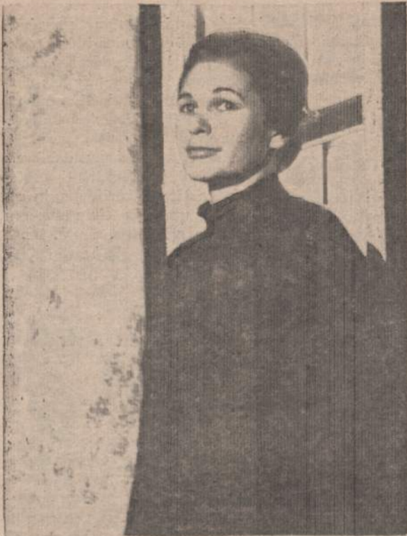
Martha — Albert Camus veikale "Nesusipratimas"