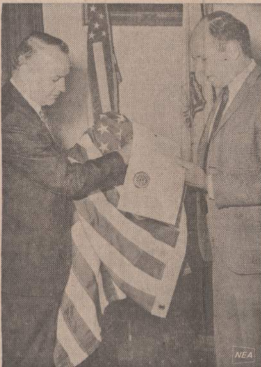
Rhode Island gubernatorių išleido specialia proklamacija sąryšyje su prasidėjusiomis Paryžiaus taikos derybomis. Proklamacijos teksta gubernatorių išteikia vietos laikraščio redaktoriui, kuris iškelia vėliava.