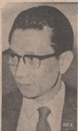
Pietų Vietnamo atstovas Bui Diem dalyvaus Paryžiaus taikos pasitarimuose. Jis yra tiksliai stebėtojas. Tuo tarpu jis neturi teisės įsikūsti į pasitarimus, bet pastebėtas nuolatikas ir keliamas klausimus iš gėdės pranešti Saigono valdžiai.

VARSUVA. — Lenkijos švietimo ministeris paskelbė universitetų ir kitų aukštųjų mokyklų reformos planus. Universitetų senatuose pilnomis teisėmis dalyvaus partijos ir komjaunimo atstovai. Bus stengia masi daugiau studentų verbuoti iš darbo žmonių ar kaimiečių šeimų.