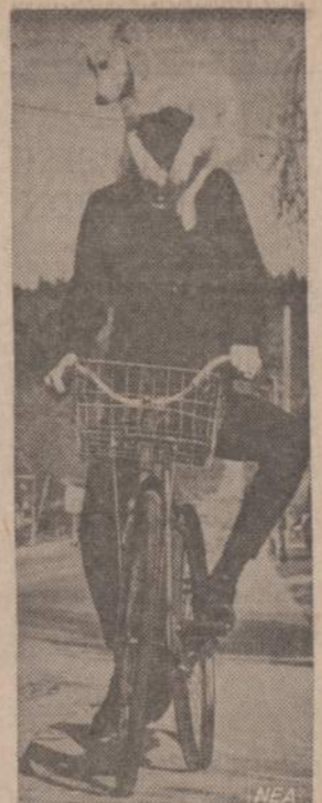
Vancouver mieste šunelis Frisca la- bai susidraugavo su savininku. Kur jis eity, ar važiuoty, šunelis neatsilie- ka. Iš pintinės Frisca užlipo ant gal- vos, bet fatai jau sudaro sunkumų va- ruoti dviratį.

Atsėdėję paras, važiuoja į Maskvą. Nuvažiavę užėjo į Už- sienio Reikalų Ministeriją, kur jiems liepė ateiti kitą dieną, o kai atėjo kitą dieną, jiems pa- sakė, kad jų dokumentai atmes- ti ir liepė grįžti į Vilnių, kur jiems būsia paaiškinta. Vyrai sutarė eiti pasiskusti Vokietijos ambasadai: už tai vėl buvo areš- tuoti, apkaltinti šnipinėjimu ir po 3 dienų tardymo nubauti po 110 rublių ir paleisti važiuoti namo.