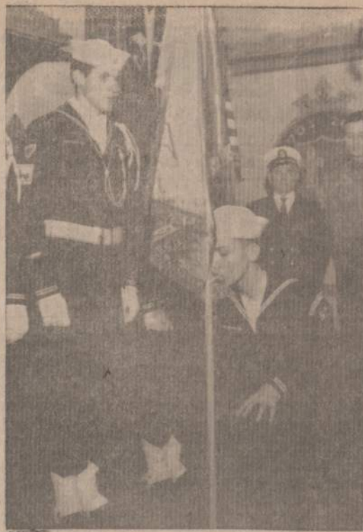
L. J. S. Jūrų skautas išdžio metu...

Gintaro pakrantė tapo laisva. Laisva tauta savais laivais savas gėrybes po plačius kraštus paskleisti. Mūsų trispalvė, plėvėsudama plačiuose pasaulio vandenyse skelbė pasauliui, kad yra tauta, kuri pakilo laisvėn, tarsi pavasario upė, kurios srovės niekas nebeužtvėnks, kad gintaro pakrantės laisvos būtų, kad Nemuno platieji vandenys mus su Klaipėda jungtų, kad