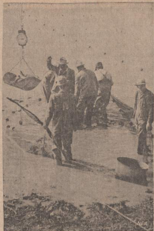
Be žemės ūkio darbu, kasdien vis didesnis fermerių skaičius domisi žuvinimu. Star City, Ark., apylinkėje matome fermerius, tinklais traukiančius žuvis iš vietos ežero.

Čekoslovakija žengia dar toliau. Tenyškėčiai komunistai iš jaunųjų palinkę ne tik rusišką bolševizmo išgyvendinimui pas