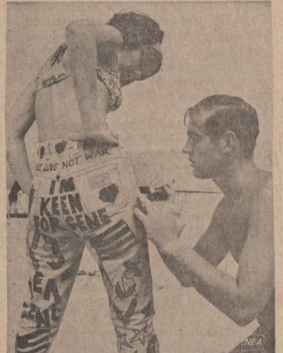
Atostogaujantieji studentai Floridoje veltui nudažo mergaičių maldybos kostiumėlius ir kelnaites, jeigu jos sutinka priimti jų skelbiamus obalsius. Viena atostogautoja leido piešti rinkiminių garšnių, bet tiktai nurodytoje vietoje.

"NAUJIENOS" KLEKVIENO DARBO ŽMOGAUS DRAUGAS IR BIČIULIS