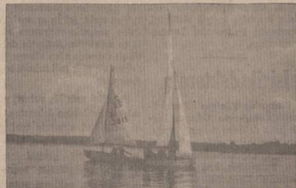
Baltos būrės plazda, bangos, duokit kelią!... Klaipėdos vietininkijos jaunieji būriuoją.

Gintaro pakrantėj Klaipėda — bus laisva!