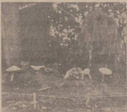
MISKO GYVENTOJAI GRYBAI PRIE PALAPINĖS Bet kas pasakys, kokie čia grybai?

Liet. Skautų Brolijos jūrų skautų "Klaipėdos" pastovyklė laukia kiekvieno jūrų jaunimo, jūrų skauto ir jūrų budžio. ISS auksinio jubilėjaus proga kiekvieno aktyvaus ar pasyvaus jūrų skauto ar vadovo pareiga atvykti į Klaipėdą, atnaujinti jūrinio skautavimo entuziazmą, įsijungti į jūrų skautų šeimos tvirtą grandinę, atnaujinti ryšius, draugystes, išbandyti bures bei irklus ir su visais bro-