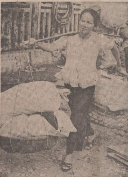
Komunistams vėl pradėjus pulti Saigona, tūkstančiai žmonių liko be pastogės. Šios motinos namai komunistu buvo sunaikinti. Ji naščiais nešasi tai, ką pajėgė išgelbėti.

Šis bandymas buvo surištas su erdvės keliavimo problemom.