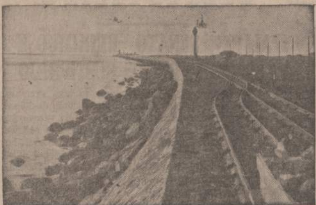
KLAIPĖDOS UOSTO MOLAS Tolimoje — vos įžiūrimas uosto žvyturys