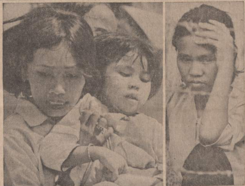
Prasidėjus taikos deryboms Paryžiuje, komunistai dar kartą pradėjo puolimus Saigono priemiesčiuose. Susirėmimų metu žuvo daug civilių gyventojų ir nukentėjo gyvenamieji namai. Pa-veiksle matome susirūpinusias Saigono moteris, netekusias namų ir kitokio turto.

"NAUJIENOS" KIEKVIENO DARBO ŽMOGAUS DRAUGAS IR BIČIULIS