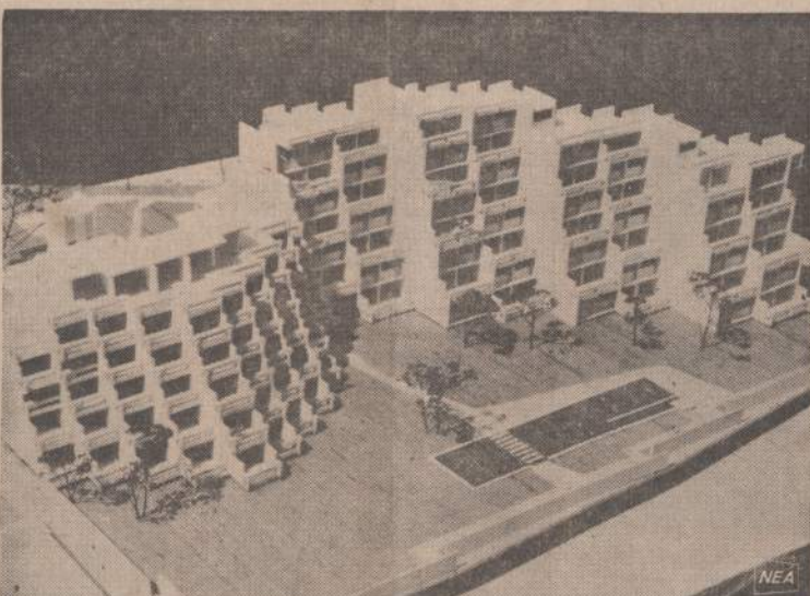
Vakarų Vokietijoje, Miunchene, garsi Volkswagen bendrovė stato paveiksle matomus butus. Ji vartoja Kanados, Montrealio parodoje buvusį Habitat modelį. Šiame pastate bus 59 butai, kuriuose bus apgyvendinti mokslininkai, dirbantieji Volkswagen bendrovėje.

Pentagonas nurodo, kad nuo karo tarnybos pabėgusių porcija su tais kurie per paskutinius dvejus metus drausmingai atitarnavo savo pareigas kraštui, yra vienas iš 28,000.