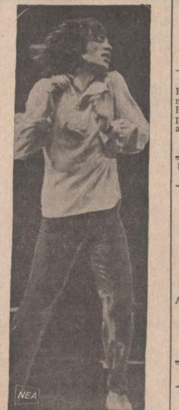
Sūkaujantis, staugiantis ir besirauvantis britų artistas Mick Jagger vėd pradėjo rodytis britų scenoje. Du metu jo nesimato, bet dabar, pramo kes su savo grupe naują dainų, jis dainuoja ir šoka.