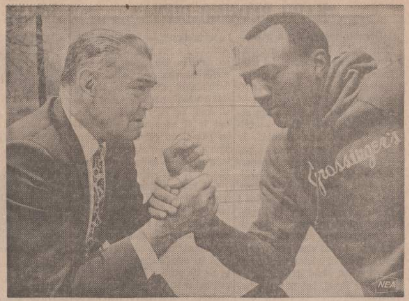
Jack Dempsey, kairėje, buvęs sunkaus svorio čempionas 1919-26 metais, moko dabartinį stiprų atletą Bob Foster, kuris gegužio 24 dieną rungsis su stipriuoliu Dick Tiger.