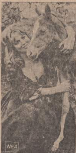
Britų artistė Fiona Lewis glosto naują kumeliuką. Filmas darbas porai dienų buvo sutrukdytas, kai vaidinusi kumelė turėjo pagimdyti pavelskė matomą kumeliuką. Filmas sukamas Airijoje, Dublin mieste.