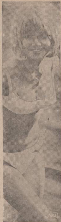
Jauna britų artistė Judy Geeson atostogauja pietų Prancūzijoje, Cannes srityje. Ji yra moderniai apsiręmusi ir pasiruošusi iškviesti Viduržemio vandenį.