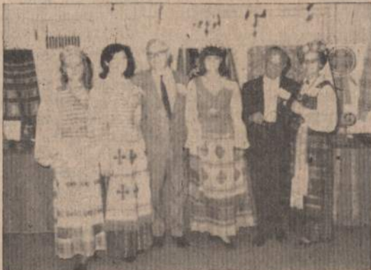
PRIE LIETUVIŠKOJO PAVILJONO

Tarptautinė arbatėlė Chicagos slaugių mokykloje