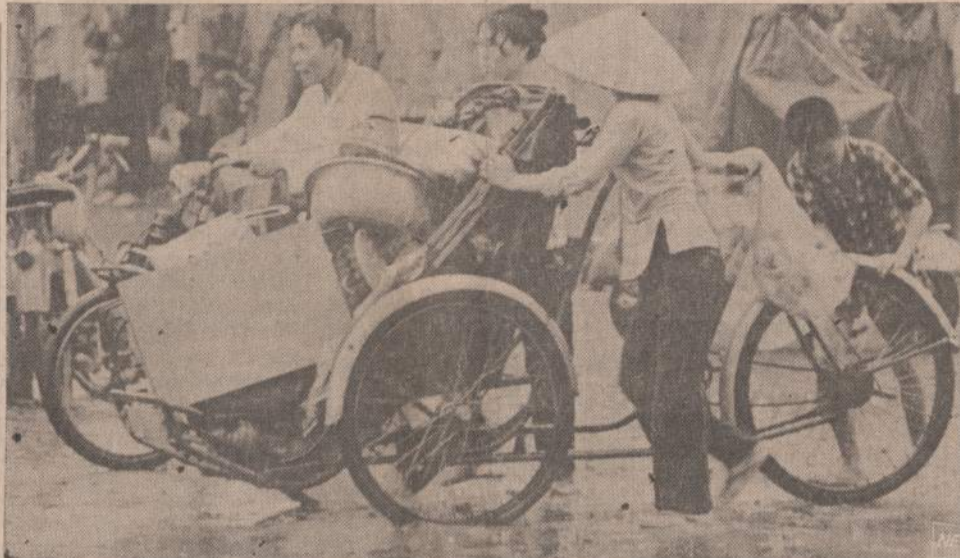
Iš šiaurės įsiveržė komunistai priselina prie Saigono ir apšaudė svarbesnes vietas. Vietnamo kariai apsupti iš visų pusių ir juos nuginkluoja, bet jie sudegina daug namų ir padaro nuostolių. Paveikslė matome sovietines gyvenvietes, bėgančius iš komunistų užpuolus Saigono srities. Jie veža savo daiktus dviračiais.