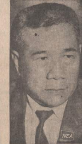
Mokytojas Tran Van Hoang paskirtas nauju Vietnamo premjeru. Manoma, kad jam pavyks sudaryti stiprią Vietnamo kariuomenę, kuri pajėgs išvysti komunistus iš provincijos miestelių ir kaimų. Iš didesnių miestų jie jau išvalyti, bet priešais liekda ir kaimus ir pašalpas. (E)

ČIKAGA. — Negrų veikėjas Jesse Jackson, gindamas netekėjusioms motinoms mokamas pašalpas, pareiškė, kad "septynių vaikų motina turi sunkų darbą". Ji auginanti tautos piliečius, karius, statytojus ir daktarus. Už tai jai reikia mokėti algą.