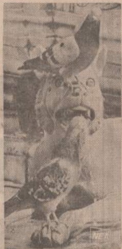
Italijos menininkai paliko įvairių paminklų savo darbu. Matome Sienos miestelyje pastatytą fontaną, kur iš žveries nasru žiemą ir vasarą bėga vanduo. Atrodo, kad net karveliai bijo Afrikos žveries antras. Kol vietos geria tekančią vandenį, antras karvelis eina sargybas.