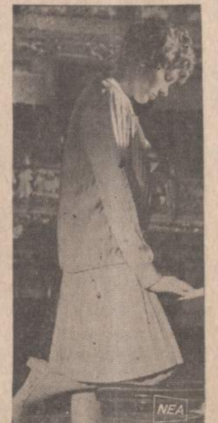
Britų kino artistė Julie Andrews vaidina filmą, vaizduojantį artistės Gertrude Lawrence gyvenimą. Paveiksle matome artistę, besirengiančią dainuoti mirusios artistės mėgiamą dainą. Julie Andrews yra viena sava-rankiškiausių moterų pasaulyje.