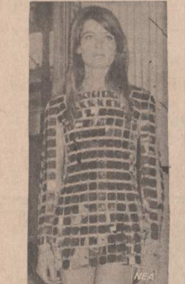
Prancūzų dailininkė Françoise Hardy dainuoja pačioje brangiausioje suknelėje. Josios apdaras yra išsiuvinėtas auksu ir deimantais. Suknelė kainuoja pusrčio milijono dolerių. Kitos tokios nei viena kita moteris neturi.