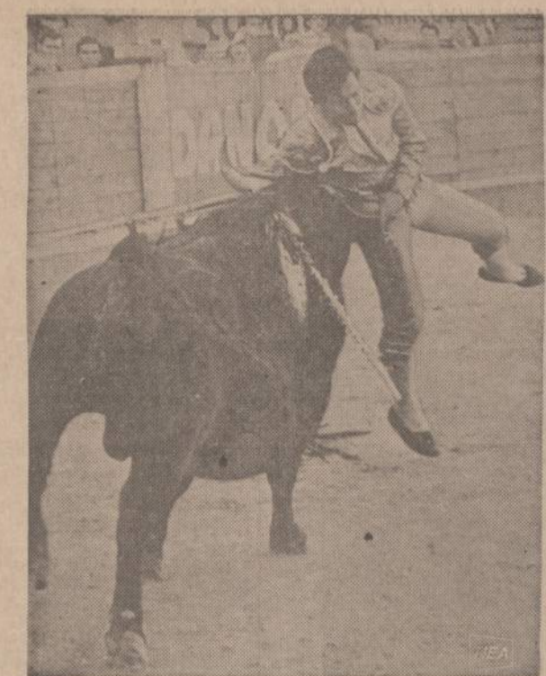
Ispanas buvo laimingas, kad bulius ne ragu, bet kakta jį iškėlė. Jeigu jis būtų iškeltas ragu, tai vargu jis būtų atsigaivęs. Už kelių minučių atsipeikėjęs ispanas vis dėlto bulių nudūrė.

Tik vieno prisibijome - padaugėjo vaju šiais 50-tais Liet. Nepriklausomybės paskelbimo metais, tas kiek neigiamai gali atsiliepti į rudens metu organizuojamą Balfu vaju. Bet tikime, jog visuomenė, nors ir gausiau aukodama Lietuvos vadavimo reikalams, bus jautri ir kur pasauli vargstančiam lietuviui ir per Balfą ties jam pagelbos ranka. Kun. V. Martinkus