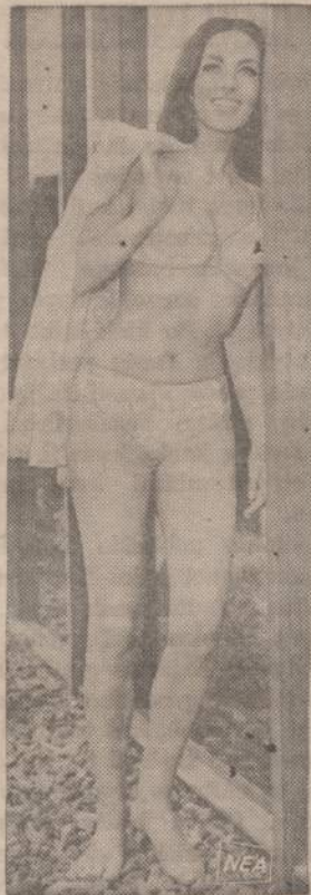
Jauna britų gražuolė, kilusi iš Kent miestelio, atstovaus Anglija birželio 26 dieną Las Vegas, Nev., vykstančiame gražuolių konteste. Ji yra penkių pėdų ir 8 colių aukščio. Josios išmieros yra 35—24—35 colių. Scenoje ji gražiau atrodė, negu kitos britų jaunos artistės.

Galiausia Nogtiovas iškelia Golovanovui bylą teisme. Jis nori Golovanovo asmenyje teisti jaunimą, kuris "išaugo svetimais, nepanašūs tiems paveikslams, atliktiems įpėdinių, taškas taškan kartojančius jo paties kažkada pieštais. Nogtiovas griebėsi "Golovanovo ir Co. bylos", kad stotų į susirėmimą su savo asmeniniu priešū". Jis mobilizuoja nuomininkus, įrodinėja, kad Golovanovą reikia teisti ir išsiųsti — net ap-