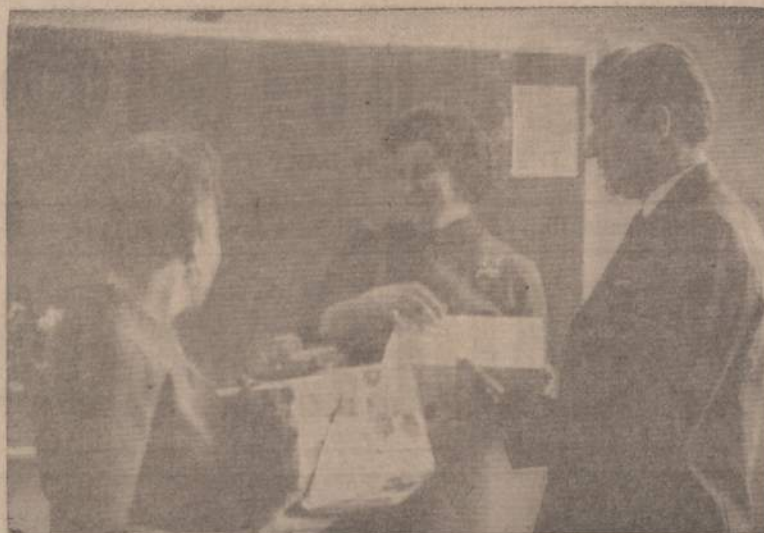
ISLEISTUVĖS ČIKAGOS AUKŠT. LITUANISTIKOS MOKYKLOJE