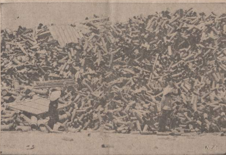
Vietname Amerikos artilerija smarkiai apšaudė priešą, kai nustato, kurioje vietoje jis yra sufrakus savo lėgas. Kovos lauke susidaro didelis krūvos artilerijos šovinų tūtelis. Vėliau jas suveža į Long Binh laukus, esančius 10 mylių atstume nuo Saigono. Tūtelis negalima naudoti antram sviediniui, bet jos tinka metalo laužiui. Galima nulietai tūteles kitiems šoviniams.

WASHINGTONAS. — Federalinė prekybos komisija uždraudė vartoti pavadinimą "Indian made" ant tokių prekių, suvenirų ir papuošalų, kurie iš tiesų yra gaminami fabrikuose. Ateityje šiuo titulu bus galima pardavinėti turistams tik tokius rankų darbus, kurie bus Amerikos indėnų pagaminti jų pačių dirbtuvėse, ne Hong Konge ar Japonijoje.