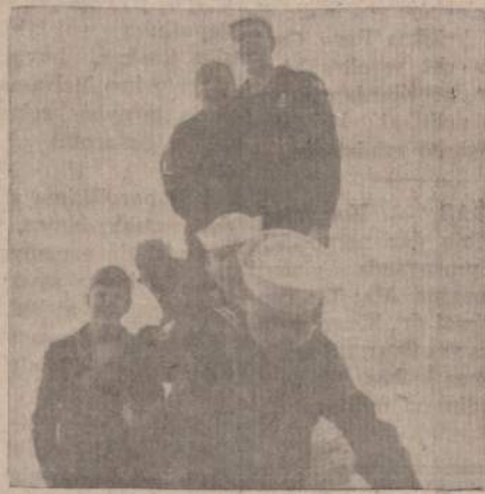
Jau Pavasarį! Džiaugiamės vandens sportu! Tai Clevelando Jūrų skautai, LJS Klaipėdos uosto junginys.

Beveik neįmanoma nusakyti jausmo, koks širdį kutena savo akimis matant šį mirgimarguliuojančią kryžstaujančią, džiuginančią, linksmą, berūpestingą, bet labai rimtą savo dalyje atliekančią, sparciai priaugančią mūsų pavaduotojų karvų... Mūsų senoji ateivių karta nei tokių savo lituanistikos mokyklų neturėjo, juoba tokių aukštai kvalifikuotų patrioty pe-