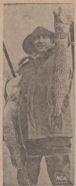
Lenkijoje, netoli Giszcko miestelio yra Niegocin ežeras. Tame ežere viename lenkui pavyko pagauti dvi nepaprastai žuvis, sveriančias po 28 svarus. Lenkai tvirtina, kad niekad anksčiau tokių didelių žuvų nepagaudavo.