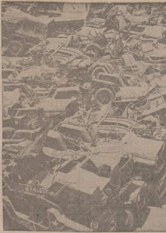
Vietname, 10 mylių nuo Saigono, yra didelis sugedusių automobilių kapynynas. Jis vadinas Long Binh. Automobiliai priklauso Amerikos kariuomenei. Kai prisirenka didelis jų skaičius, tai viskas atiduodama vietnamiečiams. Jie pasitauso mažiau sugedusių automobilius ir atranka automobiliams taisyti dalis.