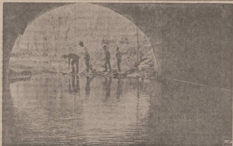
Ohio valstijoje yra Clyde miestelis, pro kurį teka upė. Keturi vaikai ryžosi iširti upės pakraščius. Įdomi fotografija traukia iš patilės.

NAUJIENOS 1739 So. Halsted Street Chicago 8, Illinois