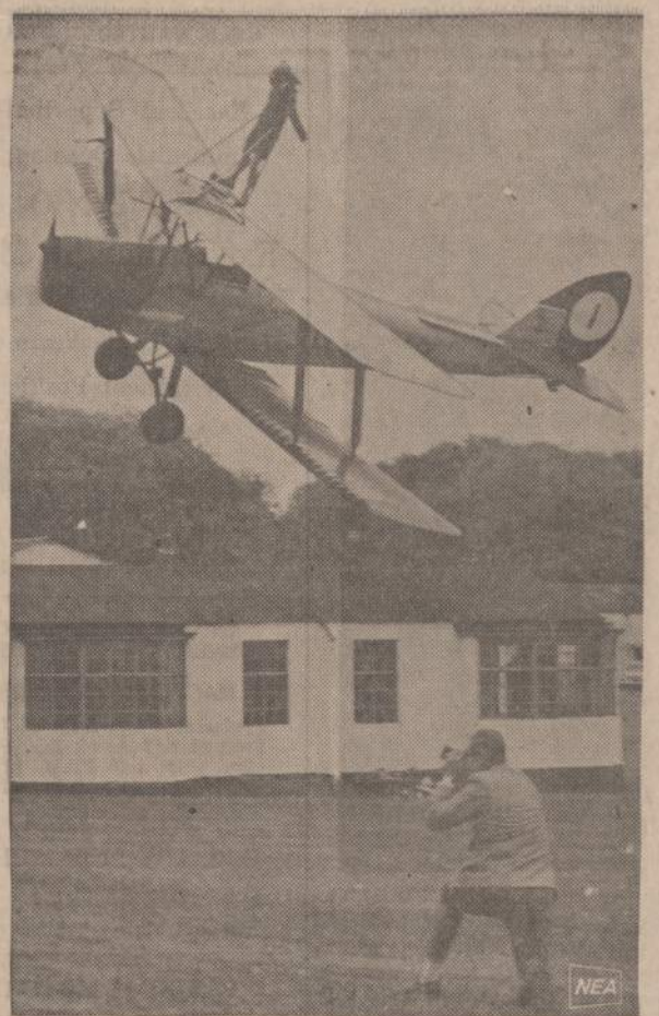
Britai labai daug laiko ir energijos pašvenčia skraidymams. Paveik- slė matome jauną akrobatę, kuri iš lėktuvo sėdynės užlipo ant spar- nų ir kelis kartus apskrido kaimelį ir akrobatikos pažūrėti susirin- kusius žmones.