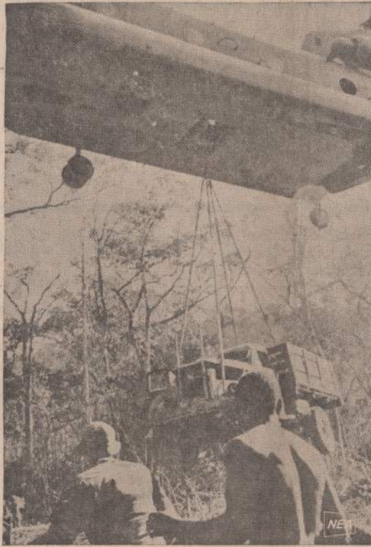
Amerikos kariams pavyko sučiupti Rusijoje gamintą sunkvežimį su kulkosvaidžiais ir šarvinėmis motoro dalimis. Komunistai istūmė sunkvežimį į tokia bala, kad jis negalėjo išvažiuoti. Amerikiečiai malūnsparniui jį velka iš purvyno. Jis bus atiduotas Pietų Vietnamo kariuomenei.

Kai šis įstatymas bus priimtas, kelionės į užsienį pagausės. Įstatymas leidžia ir ilgesnį laiką pasilikti užsienyje, neprarandant Čekoslovakijos pilietybės. Šiuo metu užsienyje leidžiama viešėti tik vieną mėnesį.