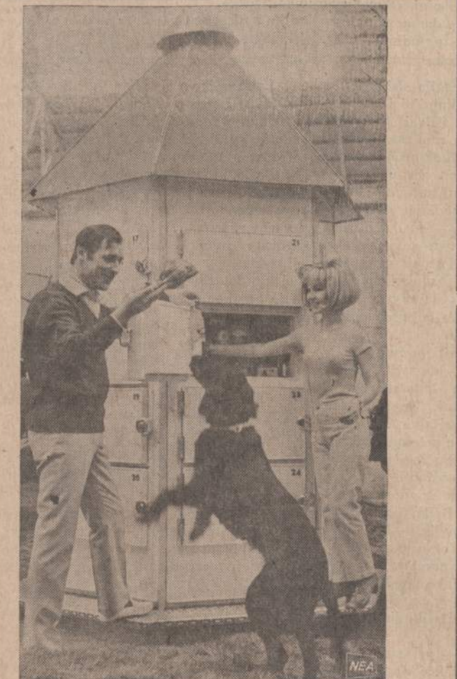
Amerikiečiai pastatė žaidytuvų vasarotojams. Kiekvienas turi savo raktą ir vietą. Ten galima pasidėti ne tik maistą, bet sumeškeriotas arba įsigytas žuvis.