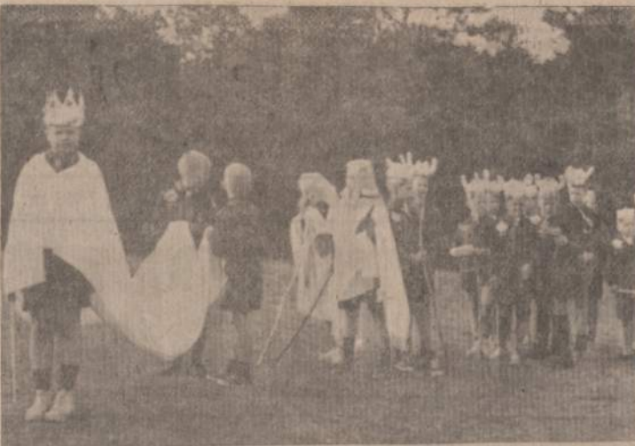
LAUKIAME EILES SAVO PASIRODYMUI PRIE LAUŽO Vaidinsime senovės lietuvių karius.

Pagrindinis skautų vyčių tikslas yra TARNAUTI. Tautinėje Stovykloje reikės labai daug talkos skautų žaidimuose, iškylose, pasirodymuose, specialiuose projektuose, tvarkos palaikyme ir t. t. Kad ši talka būtų sėk-