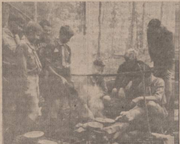
PO LINKSMOS IŠKYLOS NEKANTRAUJAME VAKARIENĖS Bet išsikępti turime patys.