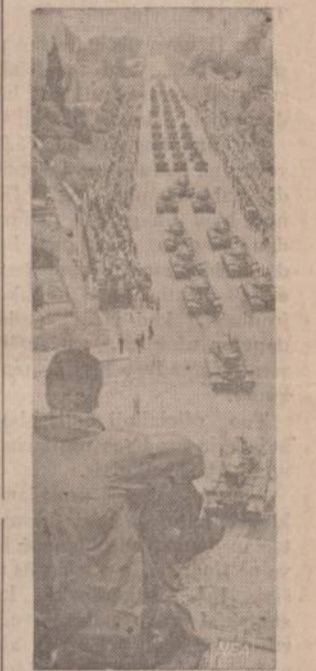
Italijos sostinėje buvo paminėta Italijos respublikos 22 metų sukaktis. Romoje buvo suruoštas didelis kariuomenės paradas, Imperijos plentu prašautė didokas Italijos tautų dainys, o padangėmis skraidė karo lėktuvai.

BIZNIERIAI, KURIE GARSINASI "NAUJIENOSE" — TURIGERIAUSIA PASISEKIMĄ BIZNYJE