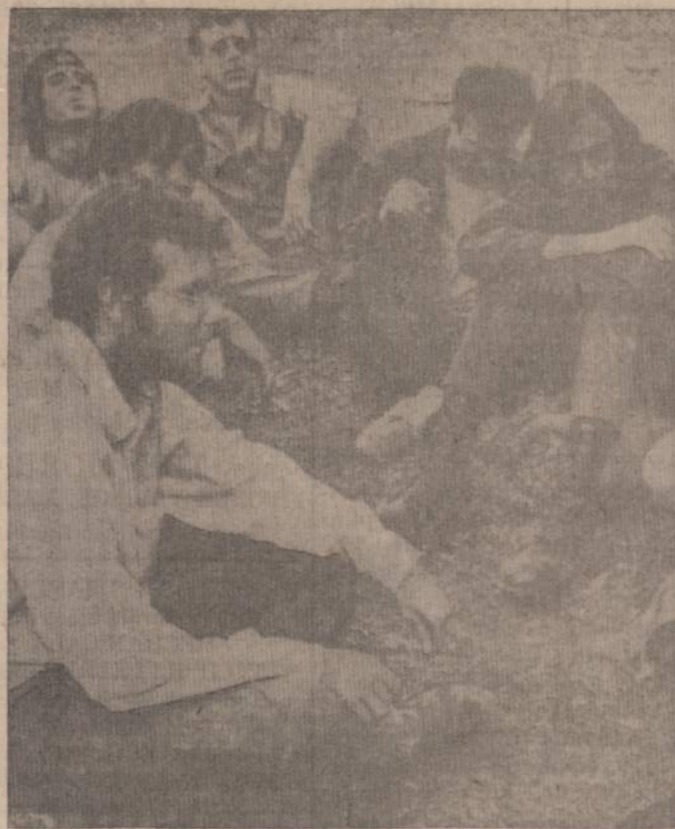
Kutvelos prie Boulder kalno laukia pasaulio galo.

"U WILL LIKE US" CHRYSLER • IMPERIAL PLYMOUTH • VALIANT 4030 Archer VI 7-1515