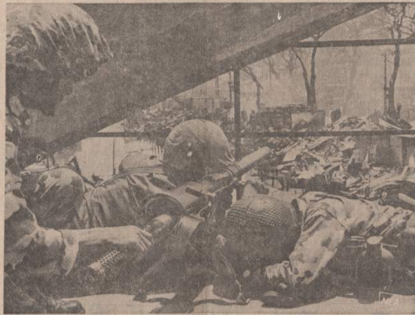
Saigone, Cholono priemiestyje Pietų Vietnamo kareiviai šaudė į komunistų užimtus namus iš prieštankinio pabūko.