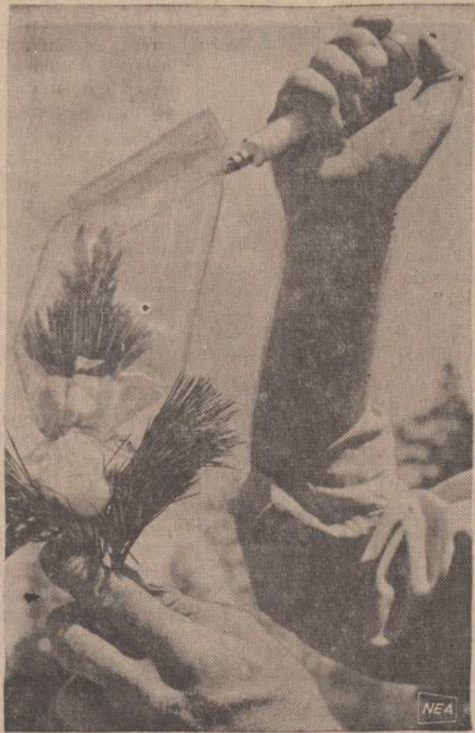
Amerikos agrikultūros departamento pareigūnas apvaisina retos pu- šų veisles kankorėžį. Maišelyje laikomomis sėklomis jis apipusto žydintį kankorėžį. Prinokusiomis sėklomis apsidinami nauji pušynai.

Dar blogiau, kad "retas idea- lizmas" iškeičiamas į asmeni- šką kapitalizmą. Tiesa pasakius, turime L. Namus, bet jie tik tiek lietuviški, kad lietuvių val- domi (žinoma, geriau negu nie- ko neturėti). Jie mūsų tauti- niams reikalams tikrai netinka dėl komercinės konstrukcijos.