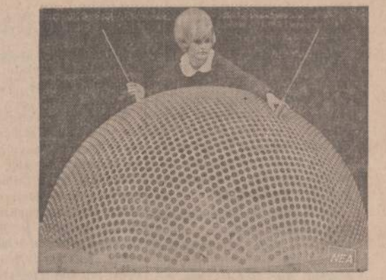
Tai pati moderniausiaji antena, kuria šį rudenį pradės naudoti Amerikos radaro stotys. Jos diametras yra 80 pėdų. Ji turi 10,000 skylių. Kiekvienas bus įklijtas specialus virbalas judantiems daiktams pastebėti. Paveiksle matoma darbininkė įsuko du virbalus.

III "Šluota" paduoda štai kokios dabartinės lietuvių "laulėsakos" (ar netinka Sniečkui,