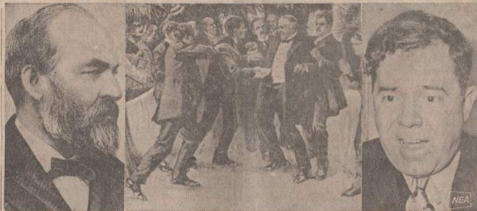
Visuose kraštuose politiniai veikėjai užitraukia neapykantos. Dažnai jų priešai kėsinaisi juos nužudyti. Amerikoje 1881 metais buvo nužudytas prezidentas James Garfield, 1901 metais nužudytas prezidentas William McKinley, o 1935 metais nužudytas senatorius Huey Long. 1963 m. buvo nužudytas prez. John Kennedy, o šiomis dienomis nužudytas sen. Robert F. Kennedy.

venės Vilkaviškyje, buvo atsi-dūres (kaip dabar sako, "pri-verstinai evakuotas") Vokietijoje, bet netoli, ir karui pasibaigus grįžo Klaipėdon, dirbo kaip mokytojas iki pensijos. (E)