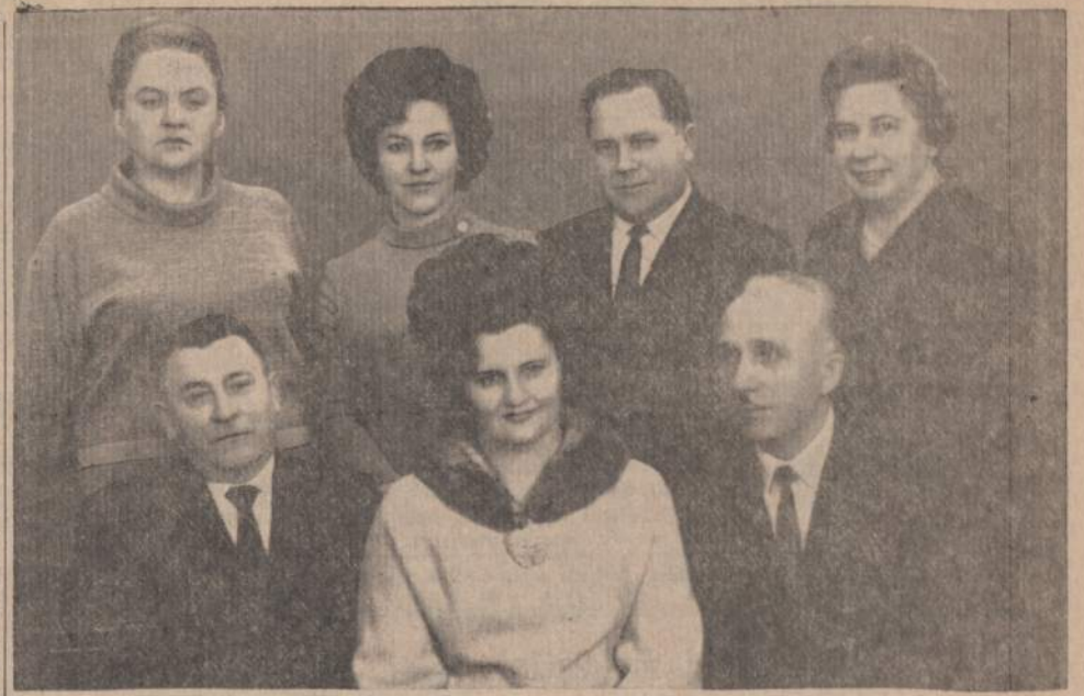
ČIKAGOS AUKŠTESNIOŠIOS LITUANISTIKOS MOKYKLOS TĖVŲ KOMITETAS