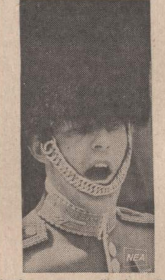
Londonė gusary gvardijos komandierius įsakinėja karalienės rūmus saugojantiems kariams. Komandieriaus balsas turi būti stiprus ir garsus.