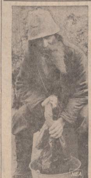
Senas Ilinois valstijos ūkininkas, turįs farmą Wadams Grove, Ill., slėnyje, mano, kad geriausia drabužius plauti senoviniu būdu. Savo kelnes jis plauna tuo pačiu būdu, kokiu prieš 62 metų motina jį išmokino.

Iš to — "naujos ekonominės politikos" siūlymas: "Turbut atėjo laikas padėti tiems žmonėms realizuoti savo produkciją. Mes dabar visokeriopai remiame pinti verslininkų produkciją, kad verslininkų produkcija būtų gerai realizuojama". (E)