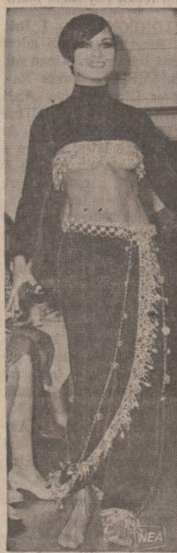
Moderni šokėja New Yorko madų salone rodo pačios naujausios mados šokėjos drabužius. Ji dėvi sargono sijonėlį ir bolero.

Čikagos Lietuvių Taryba JAV LB Čikagos Apygardos Valdyba